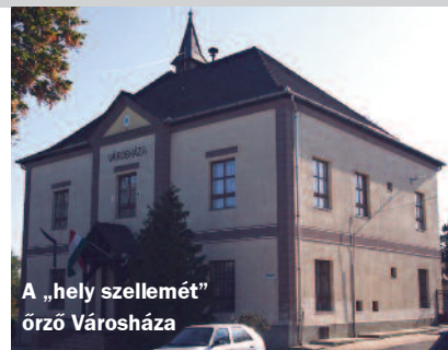
A „hely szellemét” őrző Városháza

Már a régi rómaiak szerint is minden helyet más-más istenség ihletett és oltalmazott. Emlékeztünkben a szülőföld és más maradandó élményeket nyújtó helyszín, a természet, táj, épített környezet és éghajlat átélhető változatossága, tisztasága miatt, a települések, utcák, házak ugyanúgy „élnek” közöttünk, mint akár szeretteink, vagy azok emléke. A domboldalak, fasorok, kerítések, homlokzatok – az ég és a föld által határolva – saját térbeli adottságokkal, részletekkel és múlttal-történelemmel rendelkeznek. Ebben a környezetben úgy érezzük, mint ha meg lennénk szólítva, azaz minden helynek, így városunknak Turának is megvan saját szelleme!