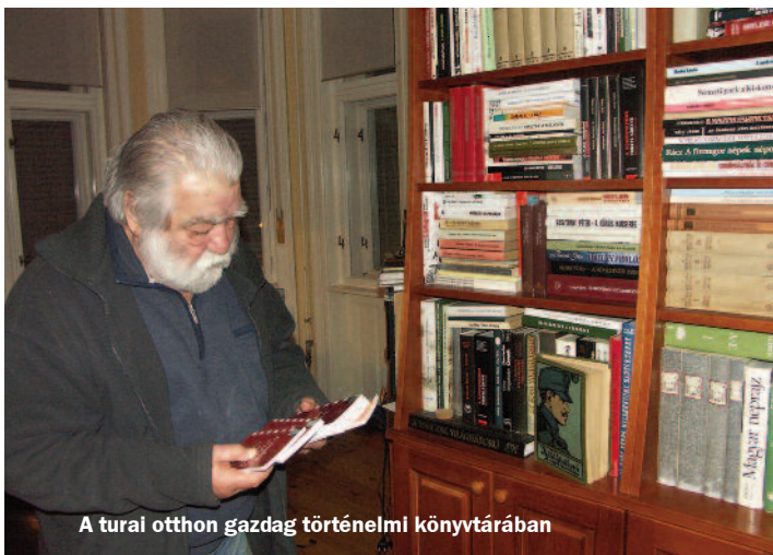
A tural otthon gazdag történelmi könyvtárában