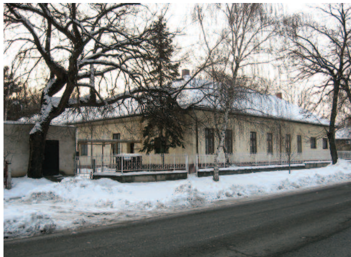
Az intézői házból óvoda