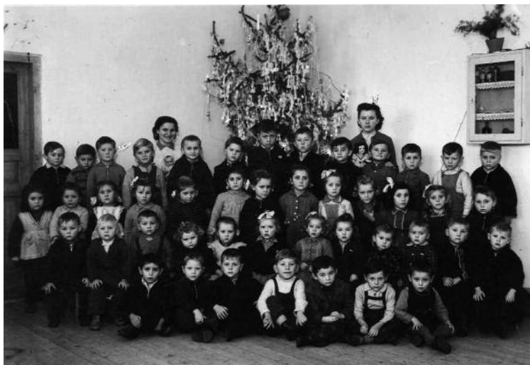
Az első ovis csoport – 1954