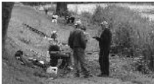
Élet a parton