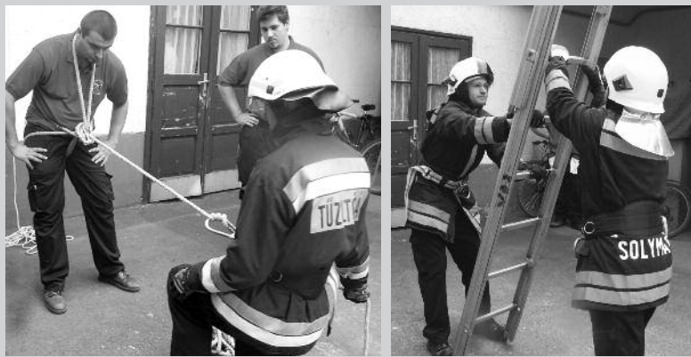
Az elméleti részek mellett a tanulók számot adtak gyakorlati ismereteikből is.

tudnak nagyobb tüzeknél beavatkozni, de a turaiaknak van saját autójuk és készenléti szolgálatot látnak el mind éjszaka, mind hétvégeken. Ez igen nagy segítség.