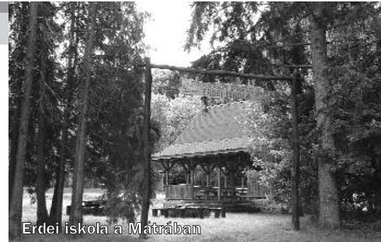
Erdei iskola a Mátrában

Tudjuk azt is, hogy preferált energiaforrások készleteink végesek, és előállításkor káros melléktermékekkel jár. Az atomerőművekben keletkező veszélyes hulladék kezelése a világban ma is megoldatlan. A jövő útja, a megújuló energiaforrások (nap, szél, vízmozgás és a geotermikus energiák) kiaknázása. A vegyszerek (pl. az általunk folyamatosan használt