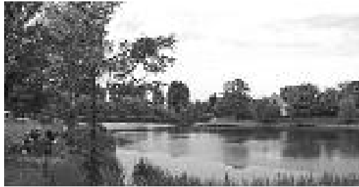
A turai horgászok paradicsoma