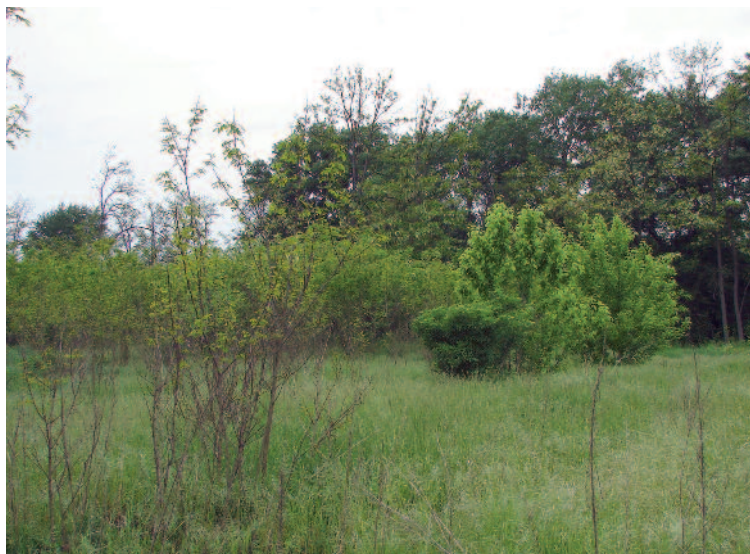
A kiirtott Honvéd-erdő

De létezik egy másik kategória is, akiknek ténykedése szinte környezeti katasztrófával fenyeget. Egész erdőterületek tűnnek el nyomtalanul, s kötnek ki a feketén működtetett tüzelőanyag telepeken, ahol az irreálisan magas ár ellenére sem tudják kielégíteni a hatalmas keresletet. Hol vannak most azok a tiltakozók, akik fellépnek a nagy építési beruházások ellen, ha három darab fát ki kell vágni? Vajon előzetesen átgondolták-e politikusaink, intézkedéseik ez irányú következményeit? Jelenleg nyitott kérdések, de a természetet igazán szerető, megbecsülő emberek számára a megoldások megtalálása halaszthatatlan. A fekete fakivágás túlnyomórészt a szakszerűséget is teljesen mellőzi, ezzel is másodlagos károkat okozva. Lassan az erdőjárás is varázsát veszítheti, az egyfolytában vijjogó láncfűrészek zajától, a fát szállító teherautók és Zsigulik rendszeres forgalmától. Ez természetesen a vadon élő állatokat is zavarja, végső soron élőhelyüket és ezzel LÉTÜKET veszélyezteti.