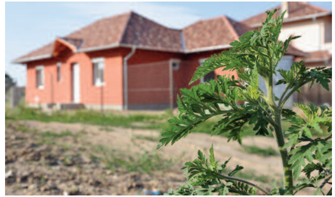
Ha parlagfüvet lát, sürgősen irtsa ki!

Tavaly és idén is folytattak eljárást ingatlantulajdonosokkal szemben, akik önként nem tettek eleget kötelezettségeiknek és nem gyommentesítettek. Ezekben az esetekben a helyszíni szemlét követően jegyzőkönyv készül, majd határozat születik, amelyben