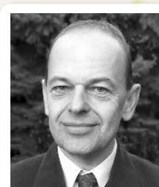
KÁLNA TIBOR GÁBOR VIGYÁZÓ KÖR