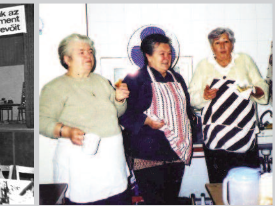
Új „családjával” a nyugdíjasklubban