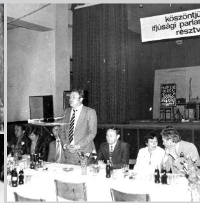
Egy tárgyaláson a 70-es években