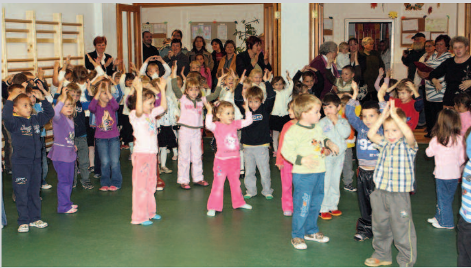
Ép testben ép a lélek – megújulás kívül-belül 60 m 2 alapterületű tornaszobával és emeleti foglalkoztatókkal