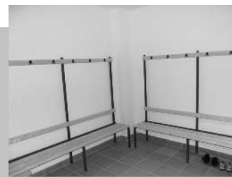
Öltözők és zuhanyzók • Ilyen volt (balra) - ilyen lett (jobbra)