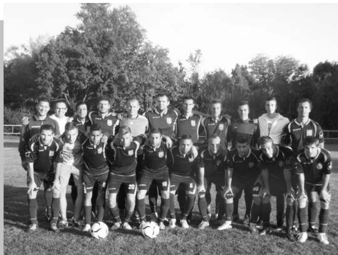
Tura VSK felnőtt csapat

A Tura VSK pályázata a centerpálya automata locsolórendszerének kiépítésére, az MLSZ pálya felújítási programjának előminősítésében zöld utat kapott 4.443.145.-Ft értékben, melyhez az MLSZ 3.110.202.-Ft támogatást nyújt saját keretéből, 1.332.943.-Ft önerő biztosítására van szükség. A locsolórendszer építése utáni pálya felújításra beadott pályázati rész forráshiány miatt nem került jóváhagyásra. Emiatt saját, 2014/15. évi TAO pályázatunkban különítettünk el 2.500.000.-Ft-ot ennek megvalósítására.