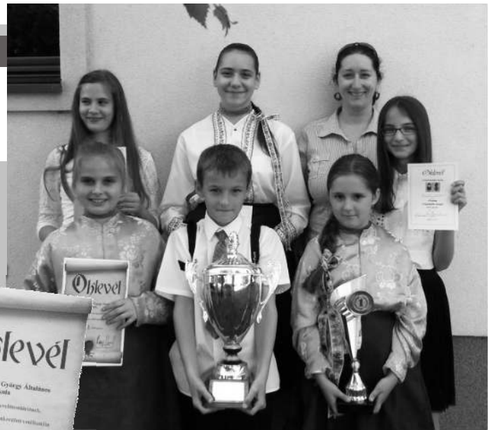
Tankerületi bajnok a Hevesy!