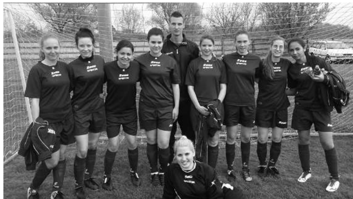
Tura VSK Női csapata