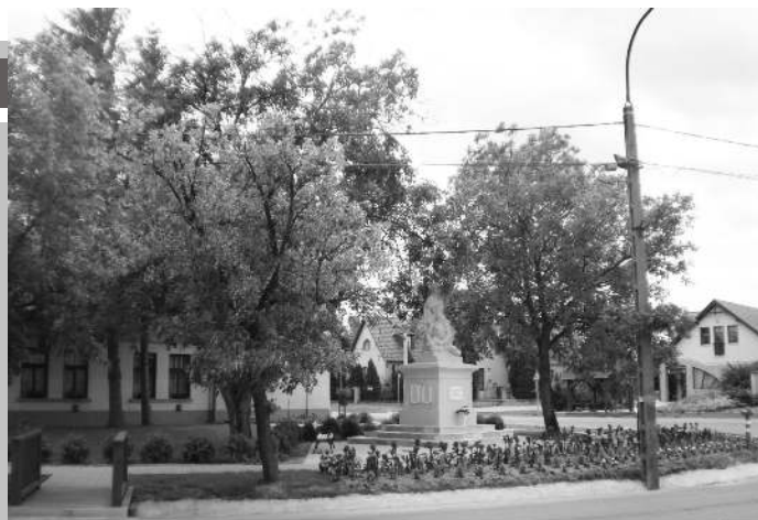
A megújult I. világháborús emlékmű parkosított környezetben