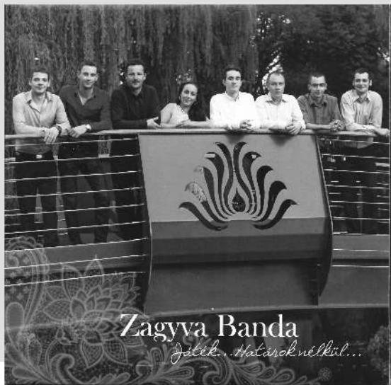
az új CD borítója