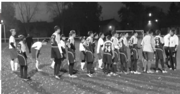
U16 Sülysáp - Tura

Még két fordulóra kerül sor ebben az évben.