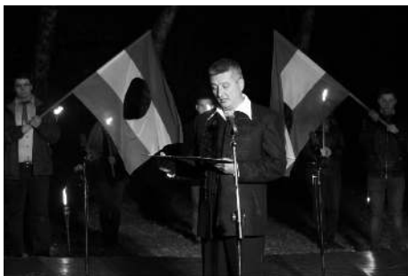
Szendrei Ferenc polgármester ünnepi beszéde