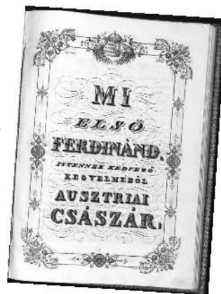
Az 1844. évi törvények első oldala