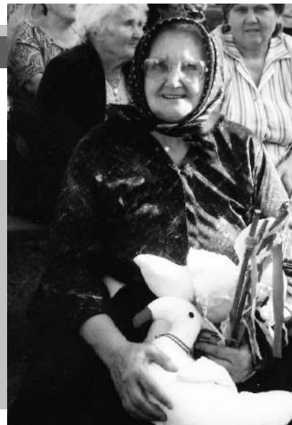
Versegi fellépés 2009

Nem volt az élet könnyű akkor, főleg a gyerekeknek, akiknek már 8-9 évesen dolgozniuk kellett, hiszen Magyarország helyzete az 1920-as évek végére stabilizálódni látszott Trianon megrázkódtatásai után, majd jött a nagy gazdasági világválság 1929-33-ig.