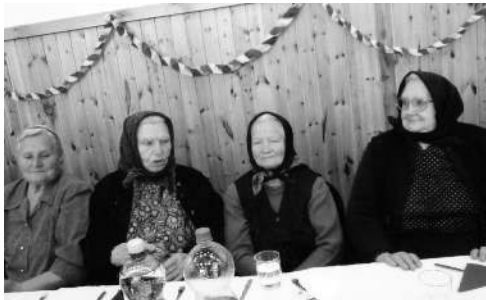
Barátnők és kártyapartnerek