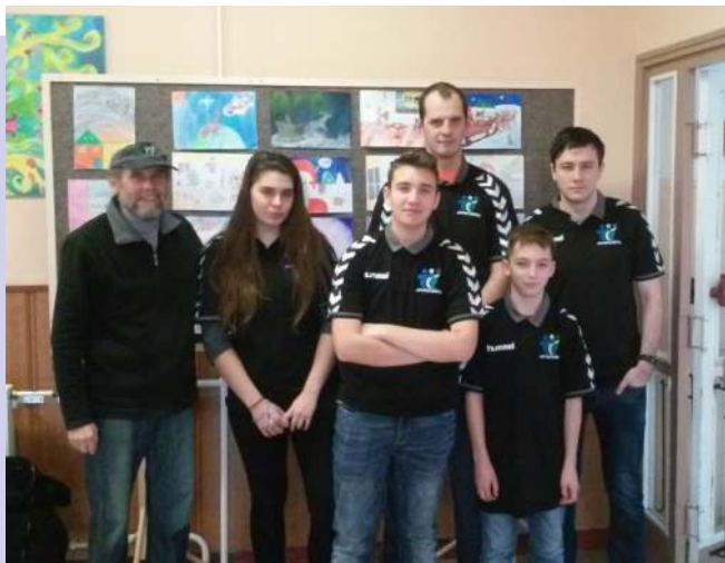
A sakkcsapat + edző