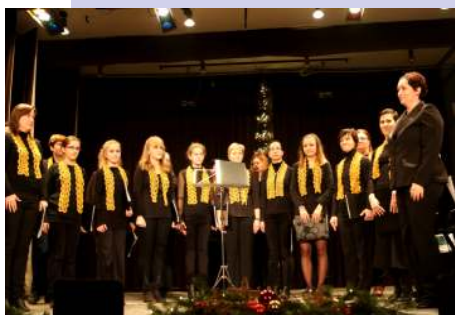
Világi Női Kórus