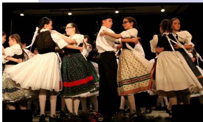
Fiatal néptáncos csoportjaink