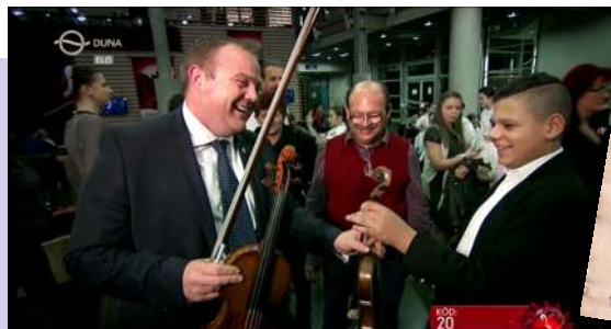
Hegedűcsere mester és tanítványa között