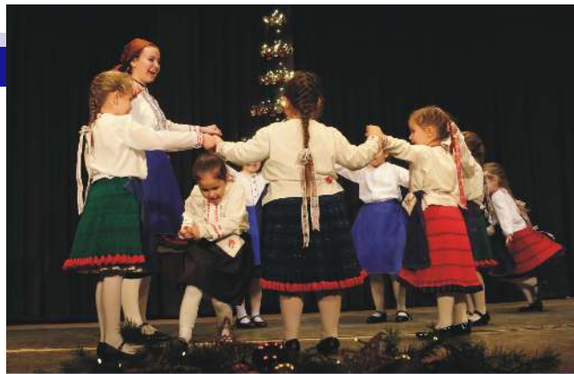
Ovis Népi Gyermejáték csoport