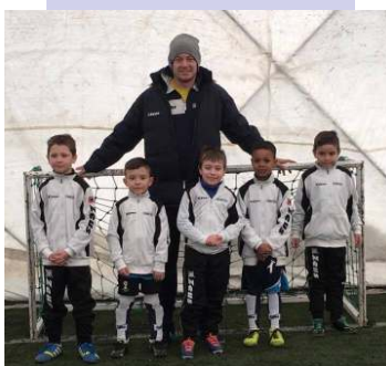
Gödöllői Sátoros Kupa a legkisebbekkel