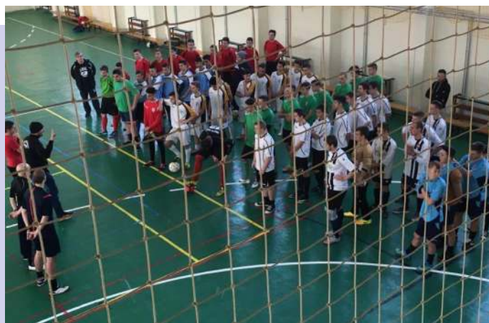
Bag, Galga Kupa, U19 torna