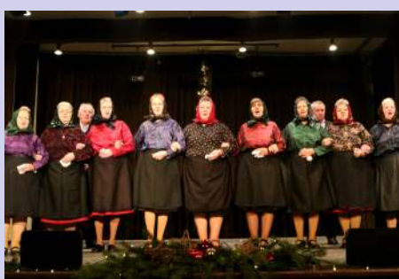
Őszirozsa Nyugdíjs Egyesület Népdalköre