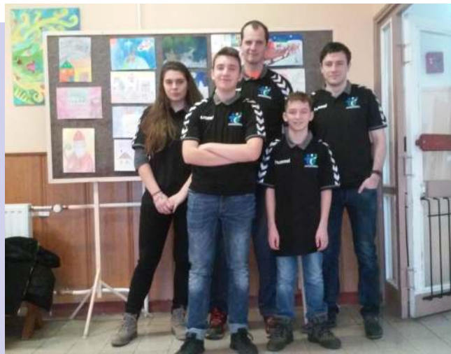
A Zsámbék elleni csapat