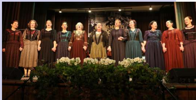
A Turai Énekmondók