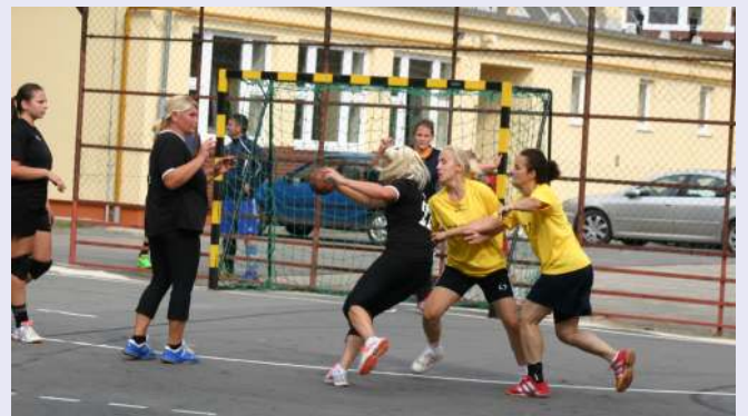
Archív felvételek a 2016. augusztus 21.-i Kézilabda Gáláról