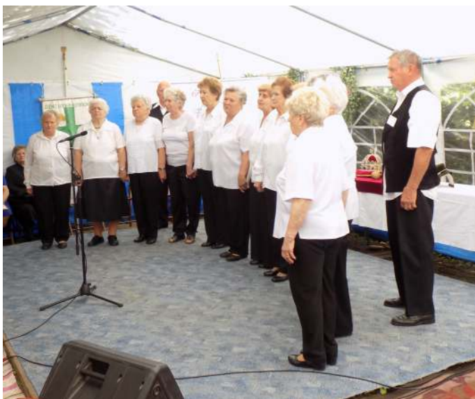
Műsort ad az Őszirózsa Nyugdíjas Egyesület Népdalköre

énekes fergeteges Rockandroll világát idéző és nagy vidámságot teremtő humora teljesen felvillanyozta a nézőközönséget és voltak, akik a zene hallatán még táncra is perdltek.