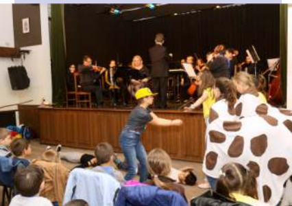
Fotó: Csilla Fotó