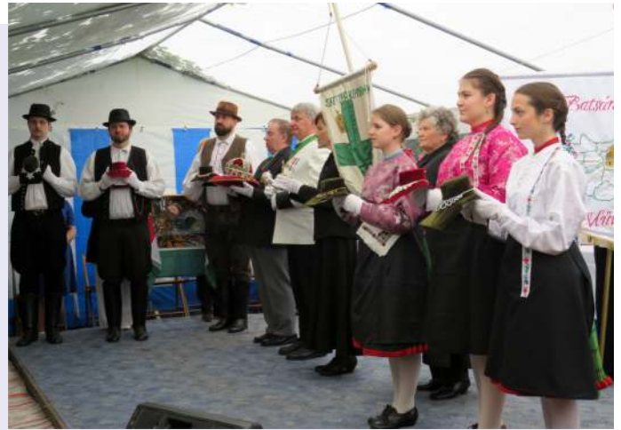
A Sára Ferenc Hagyományőrző Egyesület táncosai