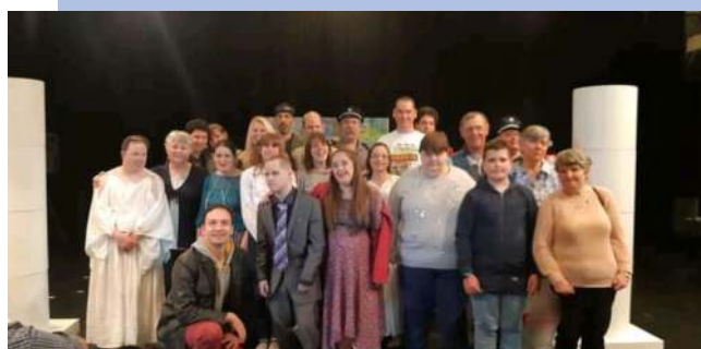
A Baltazár színház társulatával