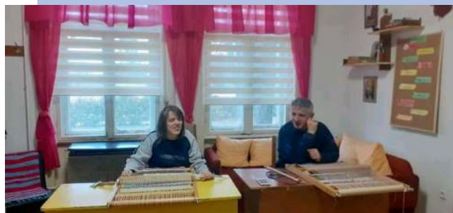
A megújult foglalkoztató termünk