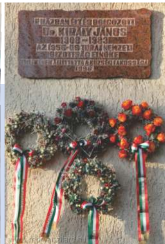
Fotó: Morvai Szilárd