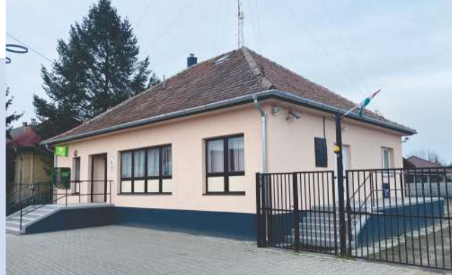
Megújult a rendőrségi épület külső homlokzata