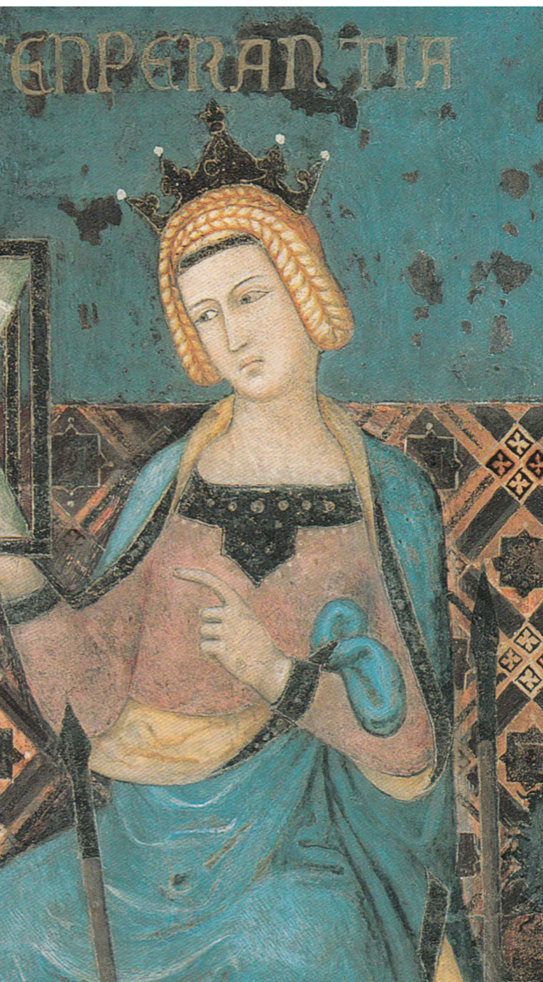
Ambrogio Lorenzetti: Mértékletesség (részlet A jó és a rossz kormányzás allegóriái című műből, 1340 körül)