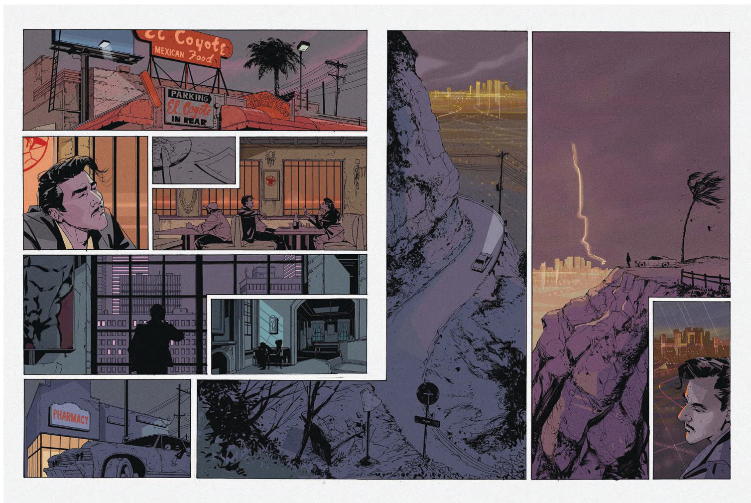
MOVIE GHOSTS (ÉDITIONS BAMBOO) Stephen Desberg | Futaki Attila

„Budapest rendszerváltozás kori világa tökéletesen megfelel a noir kritériumainak”