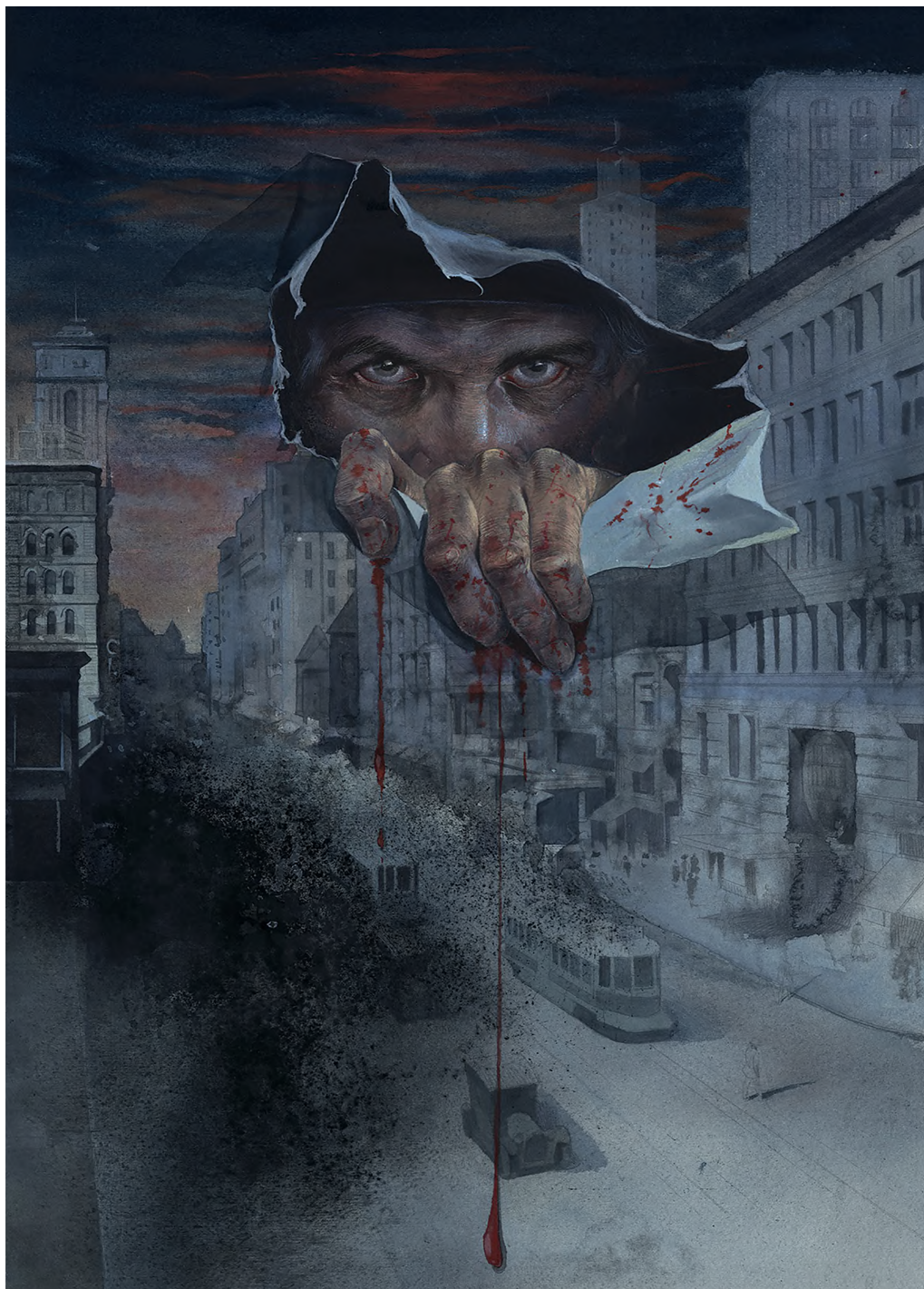
SEVERED Scott Snyder & Scott Tuft | Futaki Attila

úgy, hogy izgalmas legyen” – fejt ki. Ugyancsak fontos elemei a kor ábrázolásának a trópusi naplementés tapéták és a koloniálbútorok: ezeket látva bárki azonosítani tudja a helyet és az időt. Futaki úgy gondolja, ezzel a sorsfordító időszakokkal gyávaság nem foglalkozni csak azért, mert még élnek olyanok, akik sértésként fognák fel.