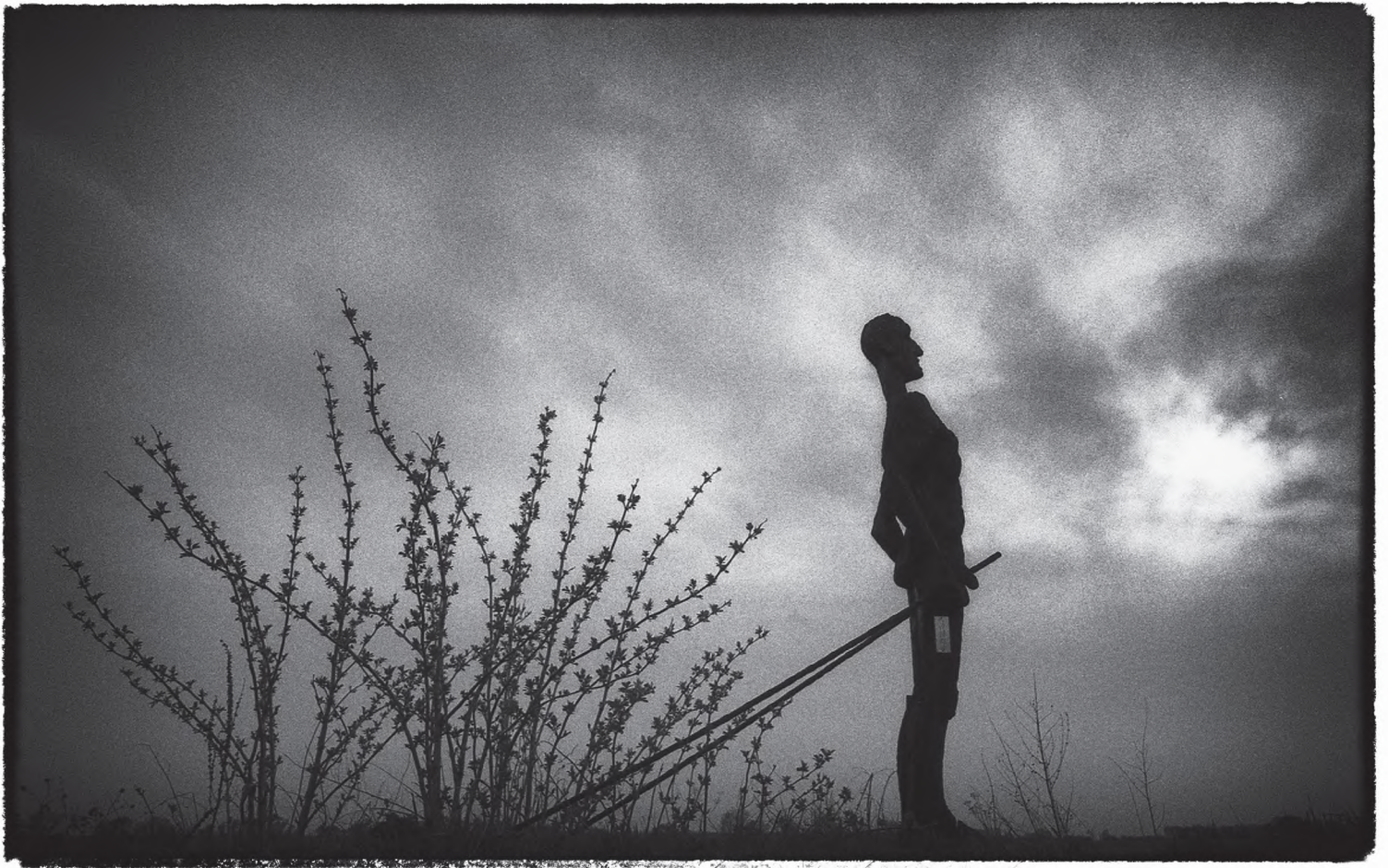
HOSSALA TAMÁS: HANSÁG – HATÁRVONAL 076

1996 | Canon EOS 33V fényképezőgép | Fuji Neopan Acros 100 film | Ilfobrom Galerie FB 3 1K fotópapír