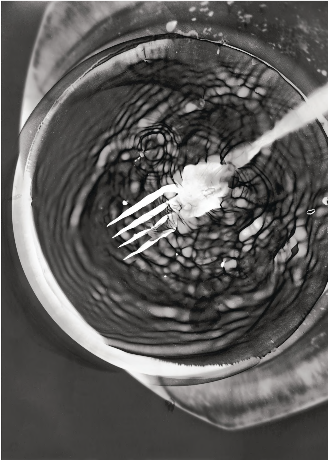
GÁBOR ENIKŐ: LEVEST VILLÁVAL 2015 | fotogram

A fotogram vegytiszta, eszköz nélküli fotográfia, amely a fény és a fényérzékeny anyag közé helyezett tárgyak árnyékát rögzíti. A vízben úszatott, mozgatott tárgyak képe átalakul, torzul. A hullámokon a fény megtörik, illetve csak részlegesen tud eljutni a fényérzékeny felületig. Az így létrehozott kép a tárgyak mozgásának egy pillanatát olyan részletességgel tárja elénk, ahogyan azt a valóságban sohasem tapasztalhatnánk meg.