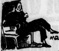
kezében tengernyi virággal közelgött munkatársunk felé az Erzsébet-híd felől.