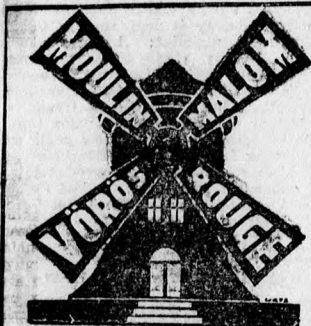
(A Fővárosi Operett-színház épületében)

• A Fővárosi Operettszínházban minden este az Orlovot adják. Vasárnap délután a Nótás kapitány kerül színpadra.