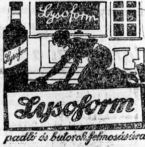
padló- és bútorok fertőzésére

A városházán már több szerkezetet mutatták be, amelyek alkalmasak lennének a házszámok olcsó és megfelelő megvilágítására.