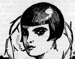
Könyves Zs. #

egyek előkelő családoknál divatrevüt akarnak rendezni,