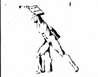
A Bajvivó: — Hurrá! Az ölcso Wallace győzött!