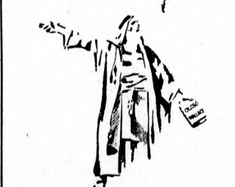
Munkácsy: Főpap: — Vádolom Wallacei, mert igazt és vakmerően ölcso.