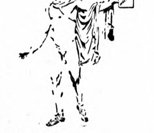
Belvedere! Apollo: — Mi ketten győztünk: én a szépségemmel, „Fante” az ölcso Wallace-szall