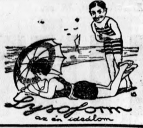
élet ványagot ütőcébe.

— Ime csak ezt tessék csinálni! Nincs baj! Világjárósi méreteket kérünk és akkor meg lehet választani a nagy forgalom, kicsi haszon lehet valóságban olcsón, nagyon olcsón árusítani, akkor akad elég vevő. Akkor előkerülnek a féltve őrzött bankók, előgurulnak a pengék, amelyek mint itt a Corvinban ragyogó ruhákra, nélkülözhetetlen közszükséglet cikkerekként váltva, egészséges életet ántenek a kereskedelmi