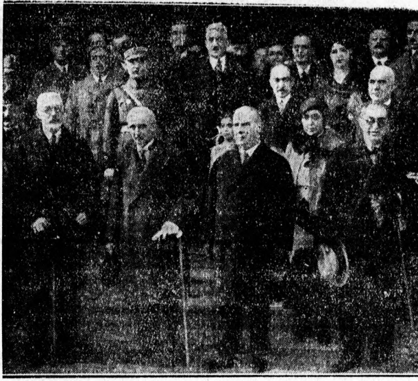
A török vendégek érkezése

A miniszterelnök kísérelében érkezett Budapestre Vedit bey miniszterelnökségi kabinetfőnök, Rahmi bey, a nemzeti takarékszági bizottság elnöke, volt közigazdasági miniszter, Nurullah Esat bey, a közigazdasági tanács főtitkára, Tevfik Rüstü külügyminiszter neje és leánya, Cevat bey, a külügyminisztérium ve-