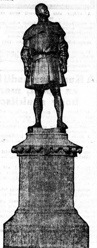
Az alpolgármester beszéde után a különféle minisztériumok, hatóságok, egyesületek, bankok és iskolák koszorúit helyezték el a szobor talapzatán.

más szépségről, más dicsőségről beszél. Hiába változtak a stílusok, az ő művei örökké élve teszik a nevét, amelyet beírt Budapest nagy építőinek és szepítőinek a sorába.