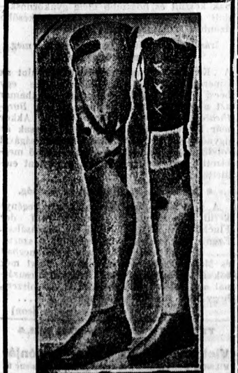
Múlthasok megváltója a képin-kön bemutatott amerikai Marks-műláb, amely összetételénél fogva nem törhet és viselője akár a tánc, koreográfiák vagy a kerék-pározas sportjának is hódolhat. A világ e legtekélyesebb műlábát Szilka műszergyáros, Budapest, VIII., Rákóczi-út 19 gyártja egyedül Magyarországon.

Tegnap este egy elegánsan öltözött fiatal leány sietett fel a Népszínház-utca 19. sz. ház ötödik emeletére. Az udvarra nyíló fo-