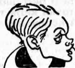
a szépséges Eleanor Holm, a 18 esztendő s lútszőrekorde

TALÁN ZIEGFELD-GÖRL — TALÁN HOLLY- WOODI FILMSZTAR LESZ