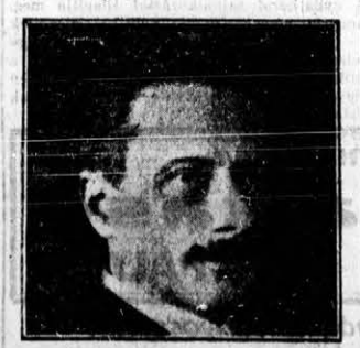
KORÁNYI FRIGYES PÉNZÜGYMINISZTER

tózkodásom előreláthatólag csupán egy-két napot vesz igénybe.