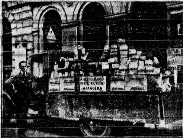
Viszik a boldog nyertesnek a Hétfői Napló keresztrejtvény-ajándékát

mégis húst dobáltak a kutyáknak s így felték őket ártalmatlanná, azután bemásztak a villába. Először az urizsóbát forgatták fel és pénz után kutattak. Eberle a zárra felriadt és bement az urizsobába, ahol három betörőt talált. A tettenért betörők fejszével támadták Eberlét és