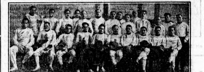
A III. OSZT. KARDCSAPATBAJNOKSÁG HATALMAS MEZÖNYE

A bíró fizetése a meccsek jellege szerint 5—4—3 font, plusz költségek, vasút és ellátás.