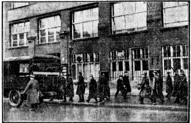
A Bülow-Platzon lévő híres Liebknecht-ház rendőrség szállította meg és házkutatást tartott. A rendőri intézkedésre az adott okot, hogy a kommunista pártvezetőség röpiratokat általános sztrájkra hívta fel a munkásságot.