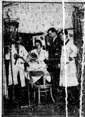
A híres becsi fociballista jodrársz áhely be (cióitben) kontrollálja a szemé gretet