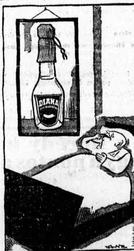
képeddel alszom el képeddel ébredek...