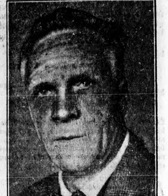
SALJAPIN ma ült 60 éves születésnapját

Magyar operát mutat be szombaton az Operaház: Mohácsi Jenő és Márkus László Arva Józsi három csodája” című mesejáté-rot, amelynek Káso György szerzette a muzsi káját. Az új mű egytől új műfaj is; pantomim énekkel.