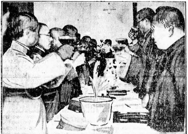
Érdekes felvétel a japán-kinai fegyverszünet aláírásakor rendezett bankettől. Japán és Kínának, a két ősi ellenségnek kiküldöttel poliharat ürítenek a békére.