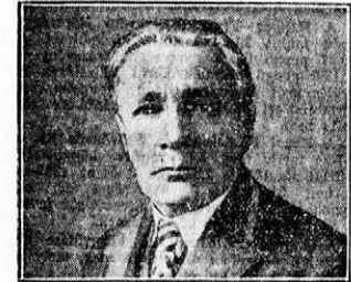
párisi „L'Auto“ főszerkesztője, a „Tour de France“ megalapítója.

los agilitással foglalkozik az összes sportkérdésekkel és ma is ép oly lelkesen készíti elő a „Tour de France“-ot, mint 27 évvel ezelőtt. Óriási elfoglaltsága mellett azonban szívesen állott rendelkezésünkre, mert érthetően érdeklődött a jelenleg Magyarországon is bevezetett „Tour“ és erre vonatkozó észrevételeit szívesen közli a Hétfoi Naplóval.