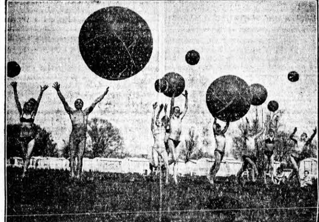
Németországban az utóbbi időben bűntelenül elterjedt a meztelen test kultusza. Az új rezsim a meztelen társaság vetkőzési szabályain apróbb „változtatásokat” eszközölt.