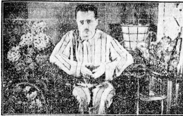
A lábadozó Dollfuss otthonában ünnepli 41-ik születésnapját.