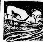
Császárfürdő fedett uszodáját csak útcéből neveztek el fedett uszárnak.

A pesti zsidó hitközség felkén építi fel a VAC Budapest új sportlétesítményét, amelynek pénzügyi realizálásáról már tárgyalnak Amszterdamban