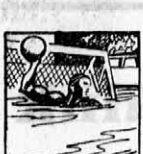
Az élen ezúttal csak a vízipólócsapatunkat láthatjuk.

Magdeburg, aug. 20. (A Hétfői Napló tudósítójának telefonjelentése.) Egyhetes kemény eszmá után befejeződött Magdeburgban az Európabajnokság. Az utolsó nap uszásban programmal kedveskedett, de annál kevesebb magyar sikerrel.