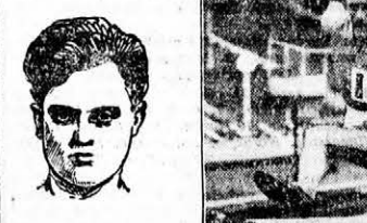
KELÉN szédületes új rekordot futott 5009 méteren

Zsuiffka minden magasságot a legnagyobb könnyedséggel elsőre vitt keresztül.