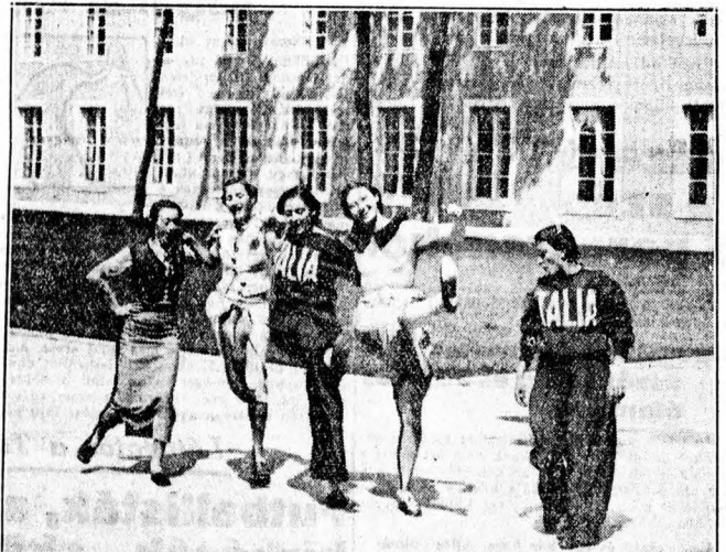
Az olimpiail falu legvidámabb lakói az olasz női atlétaik. Tánc, zene, ének har- sog, amerre járnak. Az olimpia valóban az ifju testek ünnepe . . .

A boksztólk tiztagu csoportja vasárnap reg- gel a Testnevelési Fűiskolán lévő hadiszállás- ról elatazott Mátrászöllőre, ahol egy idűlőben csendben folytatják előkészületeiket. A magas- lati levegő minden bizonyon jól fog tenni az öklövívőknek. Ez a csoport már nem is tér vissza Budapestre, hanem Mátrászöllősről csot- lakozik a birkózók kolóniájához.