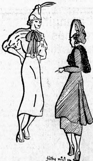
ROTSCHILD KLÁRI MODELLEI

szálai teljesen szürkévó tegyék az anyagot. Ezt a ruhát az aljon elől egy ráhajított ránccal, esetleg jumpe-