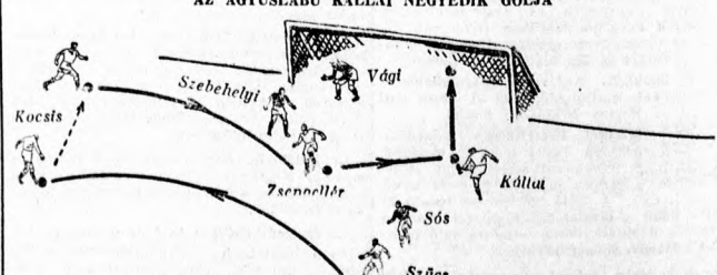
Szűcs mesteri kiadásával Kocsis függően elfut, beadását Zsengellér a múltigé álló Kállalhoz pécintli sarokkal s aztán süit a bomba. 1. félidő 30. perc. 4:0

Felszabadul a Budafok a nyomás alól, a csatársor azonban nincs a helyén, csupán Fodor igyekszik, de egy focské nem csinál — gólt! Kocsis vezet biztató támadást — budafoki kapu ellen, de elcsik és oda a jó helyzet. Zsengellér, az újpesti labdaszonglőr, oxforddal szököteti magát, de elmar-