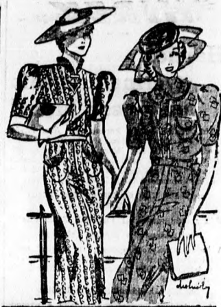
EZEK A CSINOS IMPRIME RUHAK KERESZESINÉS KÉPÖN IMPRIMÉBŐL KÉSZÜLTEK. SOKSZÁZ CSINOS MINTÁBAN KAPHATÓK A KALVINTERI FENYVES ÁRUHAZBAN LÁBAROKFÉNT 9 PENGÓ 80 FILLERERT