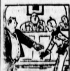
A váloperben szereplő házastársak egy vi-

A Transcontinent hangversenyállalat az idén nagyszabású operatív keretben rendez sorozatos előadásokat a Vároai Színházban, melyben előghűzres dírikenek vezénylése mellett az énekvezetés tártjárj fogják vendégvezényelni.