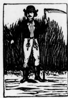
AZ ARANY KASZÁHOZ.

Magy. kir. dohány, szivar, lőpor és kártya-árulás. Első gazdasági és varrógép-, koszoru-, fa- és érczokporsó raktára.