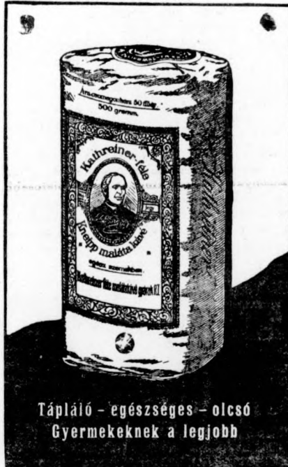
Tápláló - egészséges - olcsó Gyermekeknek a legjobb