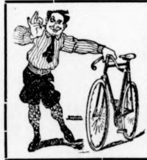
Gramofonok, lemezek legújabb felvételek!

Az összes gyártmányu, kerékpárok és alkatrészek, NSU motorkerékpár képviselő.