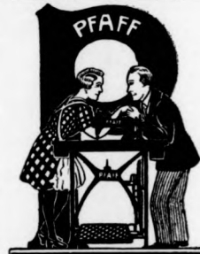
Az én legnagyobb örömem.

Csak neki köszönhetem a szép kelengyét. Kérjen prospektust.