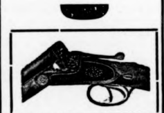
Előnyös fizetési feltételek!

Legjobb bel- és külföldi töltények, vadászfegyverek és vadászati cikkek Lőpor és robbantószer. Áruda!