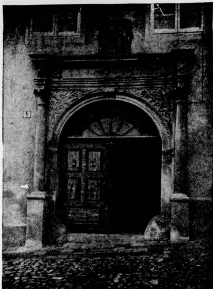
Reneszánsz portál a XVII-ik századból, Selmeczbánya