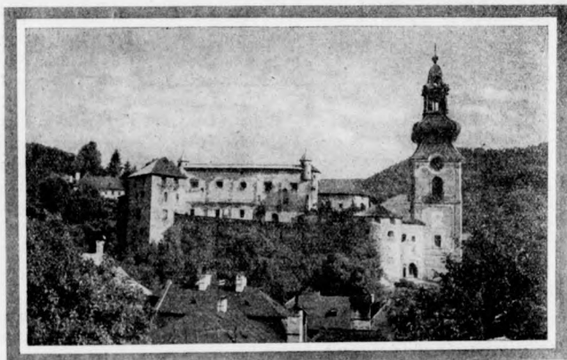
Ó-vár, Selmeczbánya a XIII—XVIII. századból.

A hegyek befogta síkokban, a feldarabolt mezőségekben, a száz és száz apró darab-