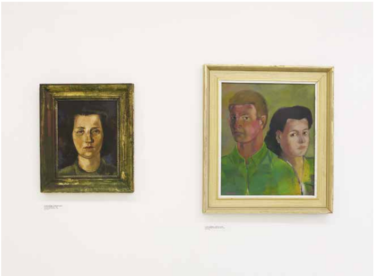
Feleségem arcképe és Kettős arckép, 1949