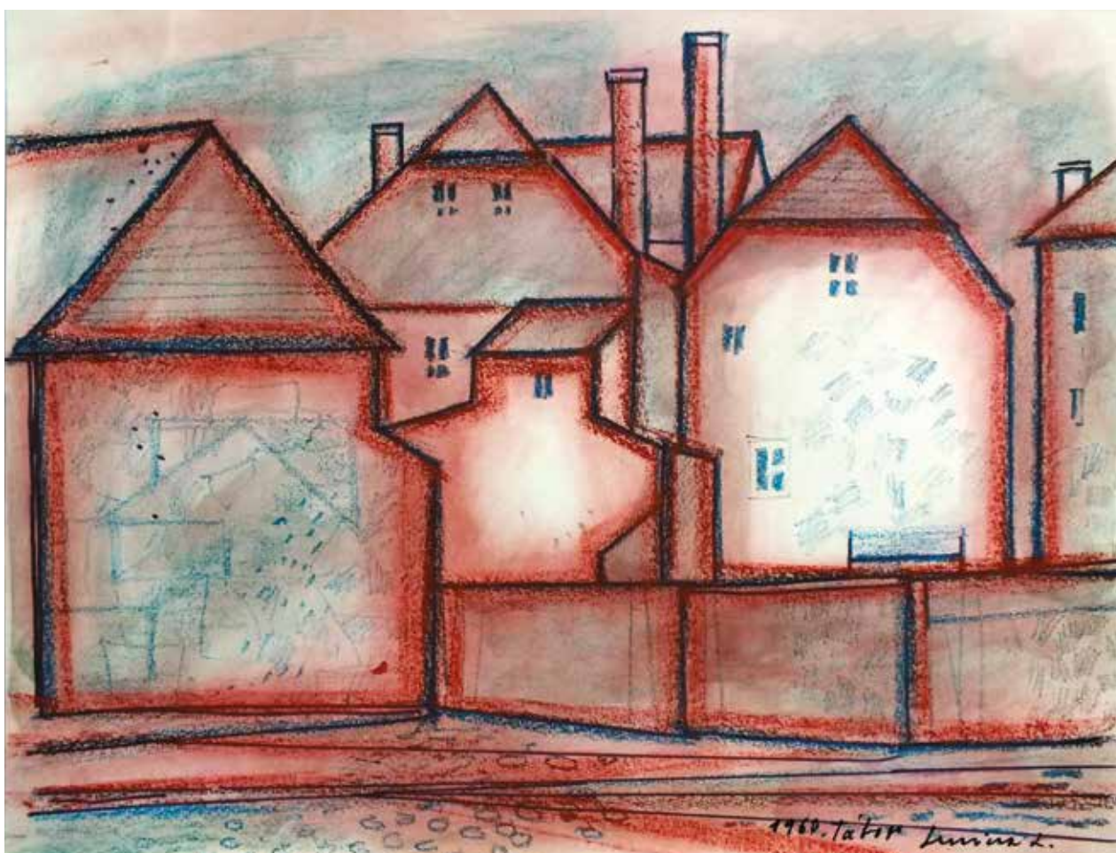
Lúszicza Lajos / Tábor, 1960