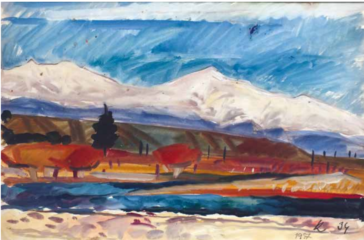
Völgyben / 1957

A kiállítás metaforikus ívben végigvezet pályáján, tanulóéveitől – utolsó korszakáig – érzékeltetve kortársaival folytatott párbeszédét. Ráadás képpen különlegessége – a galéria archívumából származó fotódokumentáció, mely először kerül közönség elé.