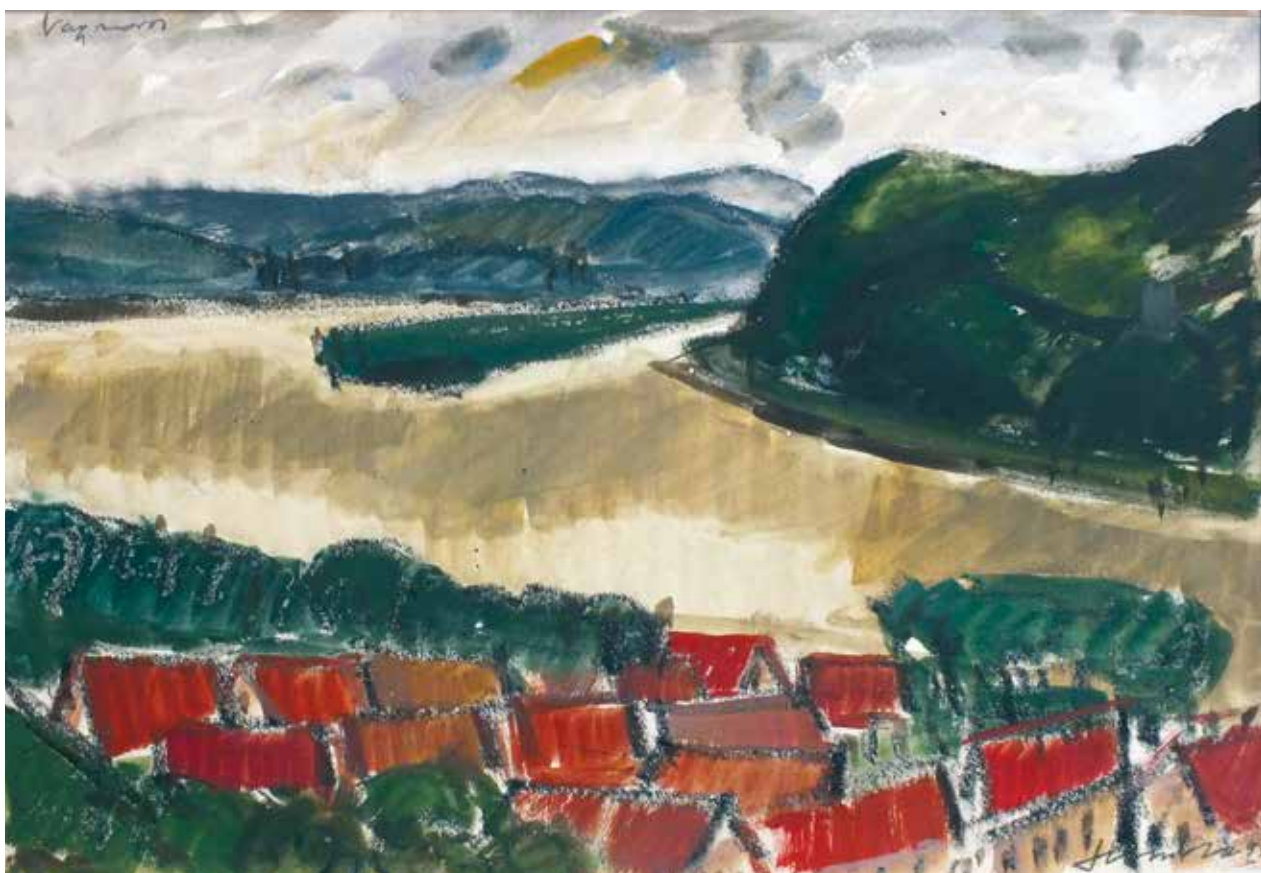
Nagyvaros / 1995