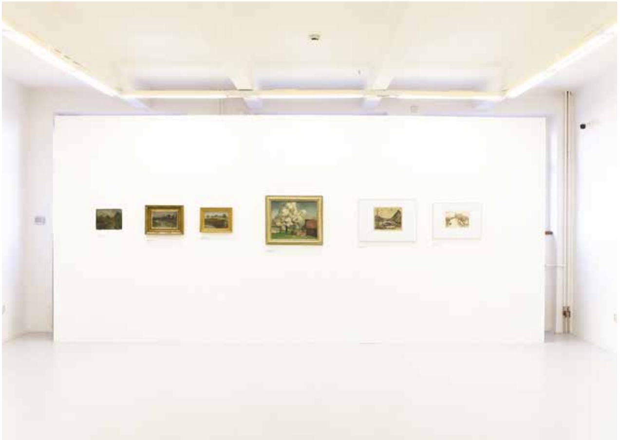
Az Ernest Zmeták Művészeti Galériában rendezett kiállítás enteriőre