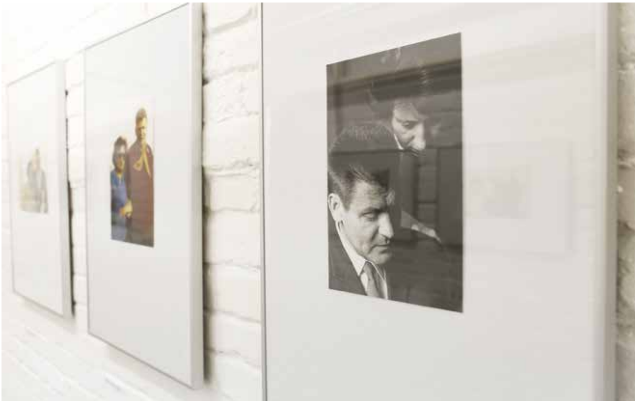
Fotódokumentumok a Luzsicza, a közvetítő című kiállításon

Az ötvenes években kezdődött két szálon futó pályája, melynek során különböző pozíciókat töltött be. Dolgozott a Népművelési Minisztériumban, főiskolai tanár, illetve a Magyar Képző- és Iparművészeti Társulat igazgatója volt. Majd Magyarország legnagyobb kiállítási intézménye, a Műcsarnok igazgatója lett (1956–1959). A forradalom utáni korszakban nyitottabb kiállítási politikát preferált, teret biztosított a progresszív tendenciáknak. A Műcsarnokban