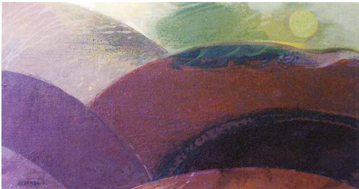
Lúszicza Lajos / Domboldal, 1962