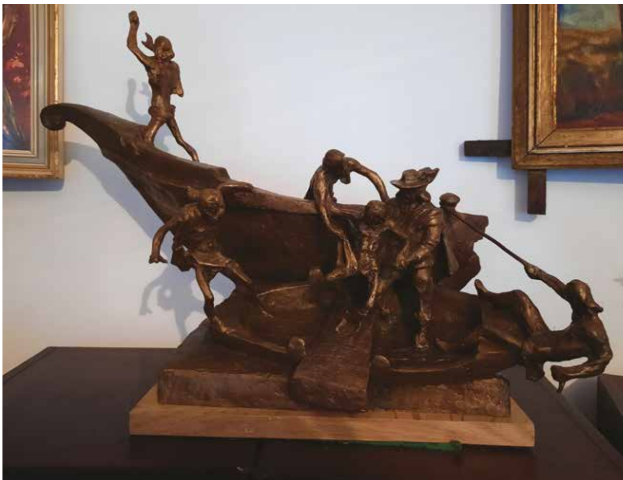
Gályarabok - terv