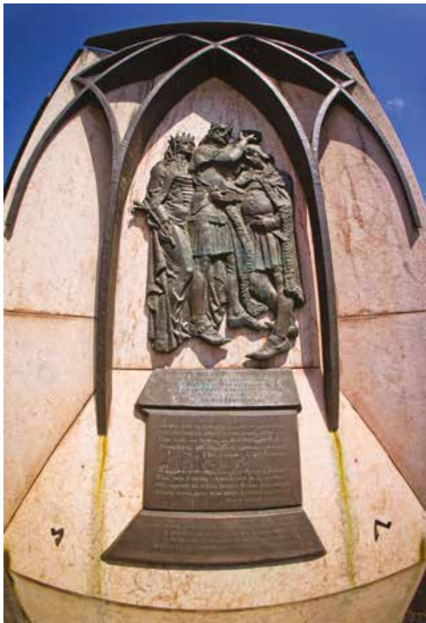
IV. Béla király és családja / Esztergom, 2000