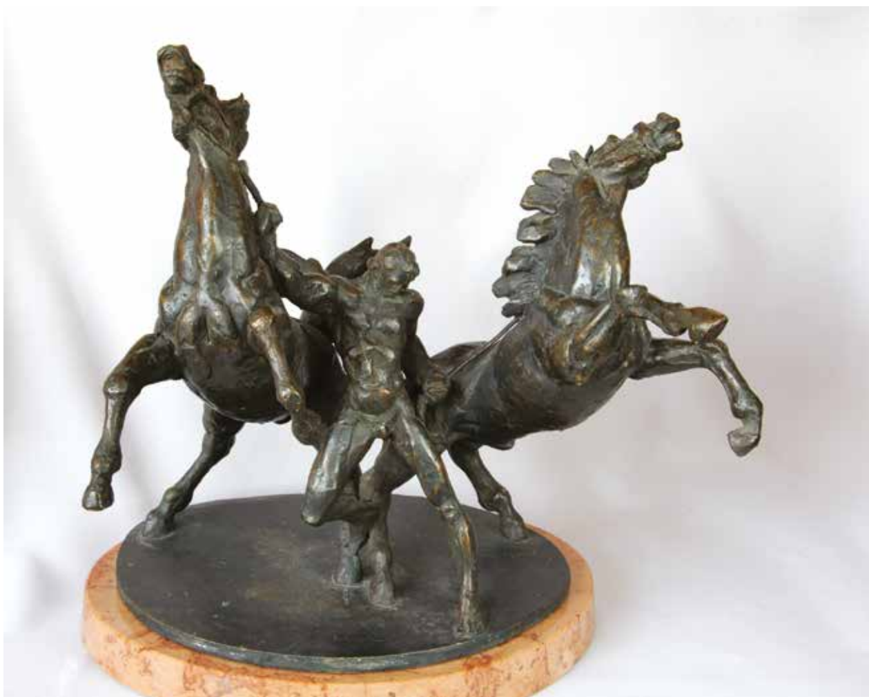
Zsitvatoroki emlékmű - terv