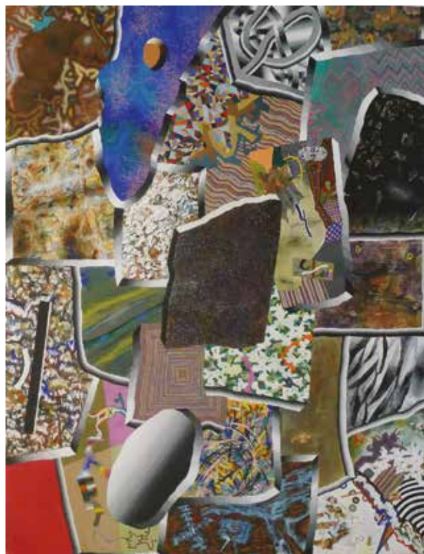
Kompozíció IV. / 2003