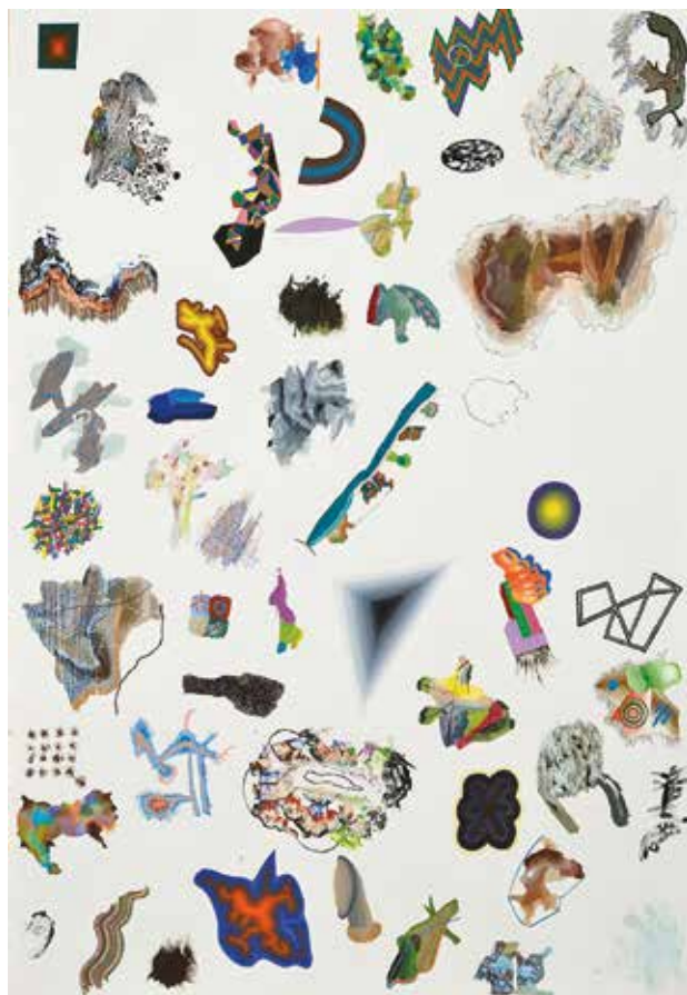
Kompozíció III. / 1996