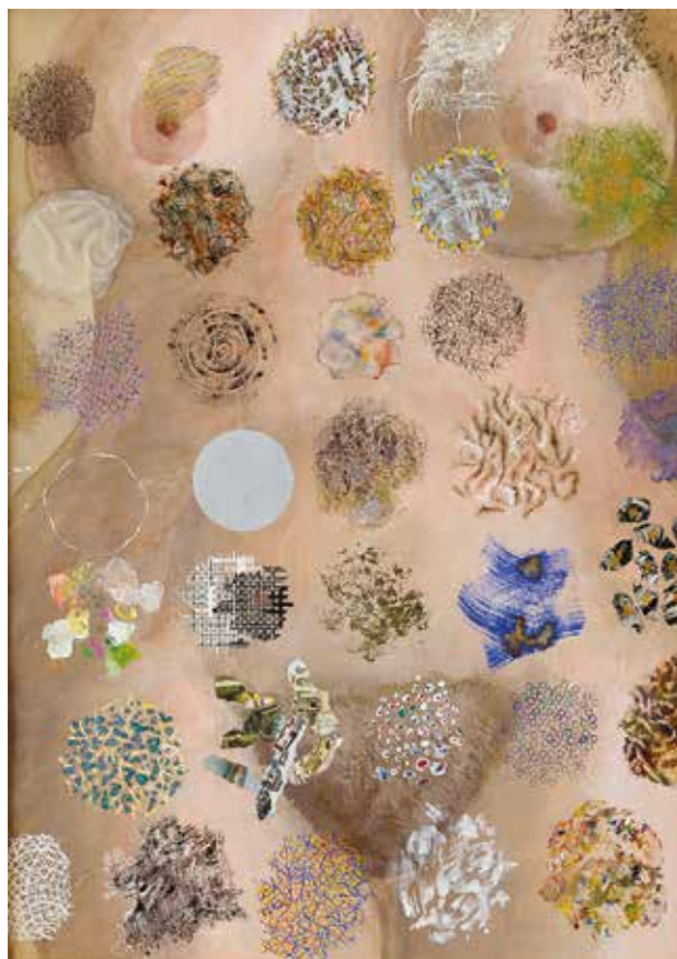
Akt / 1979