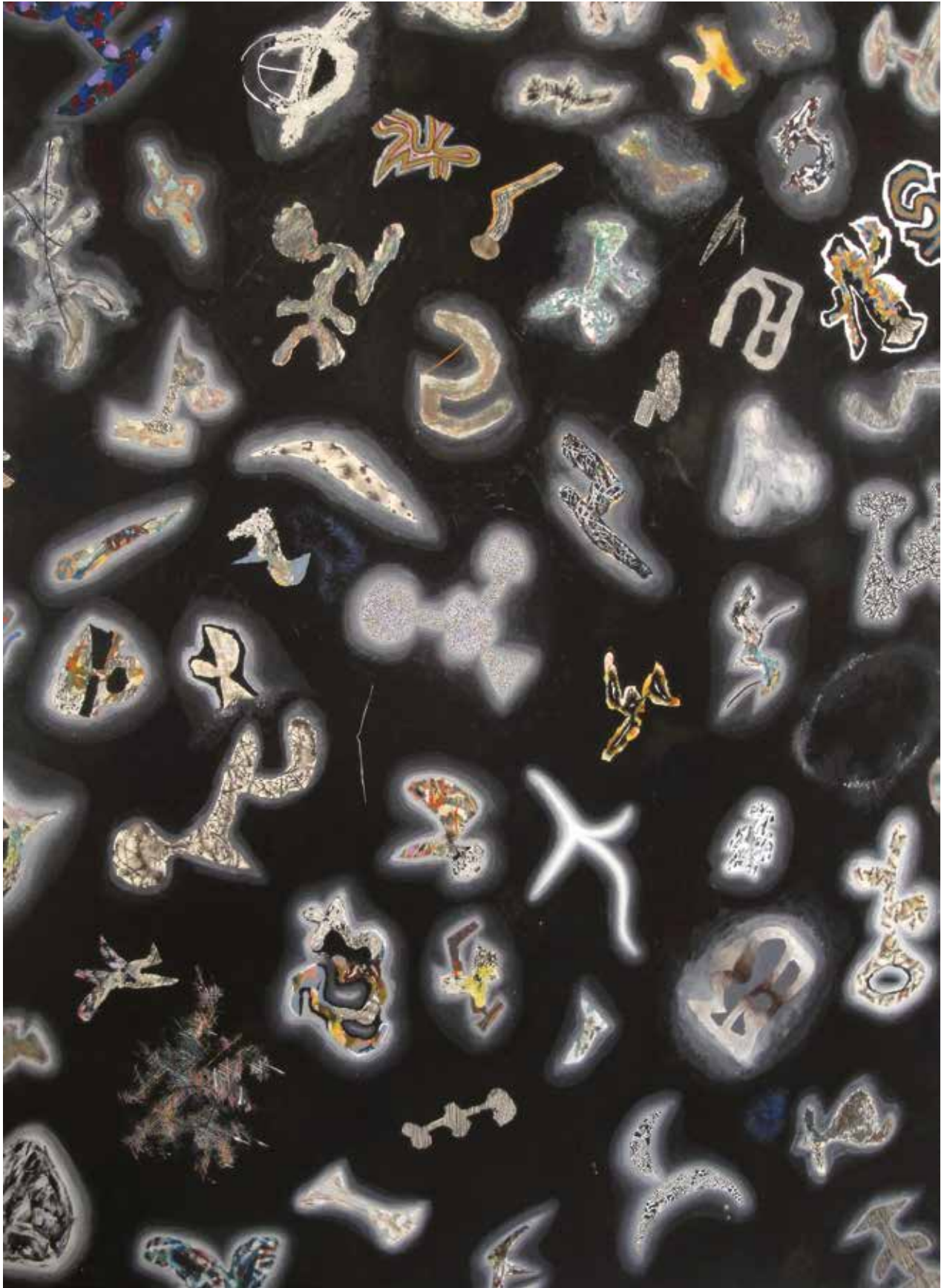
Cím nélkül / 1986