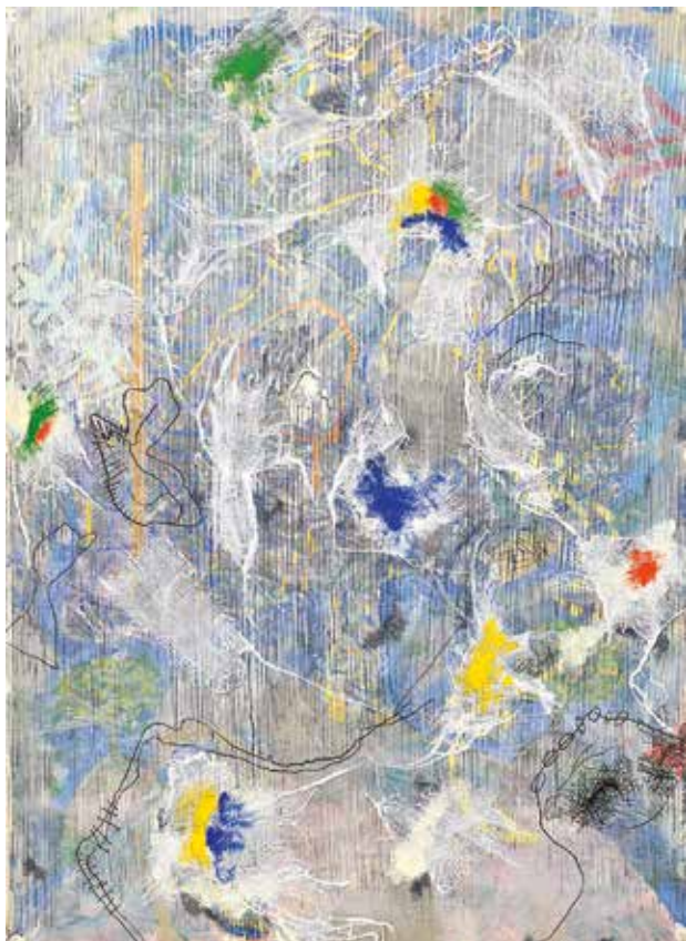
Nonfiguratív kompozíció / 1977