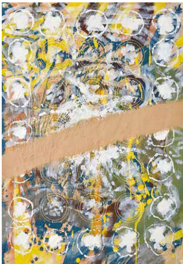
Kompozíció II. / 1974