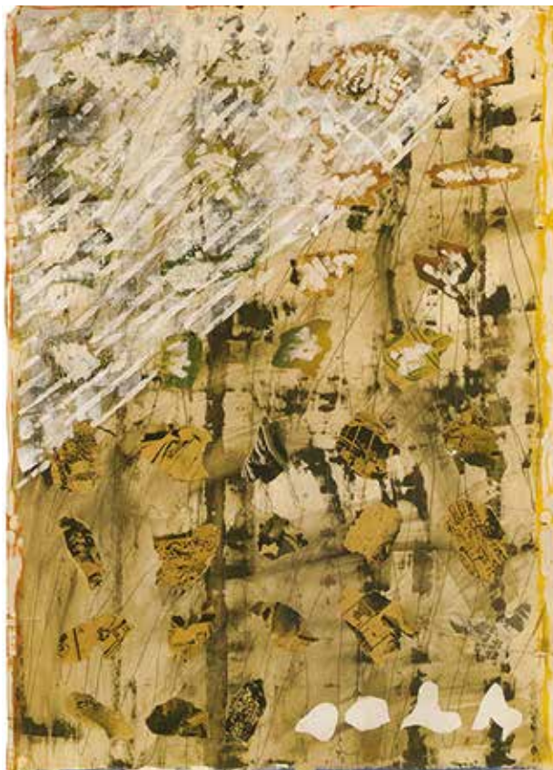
Szakadás / 1974