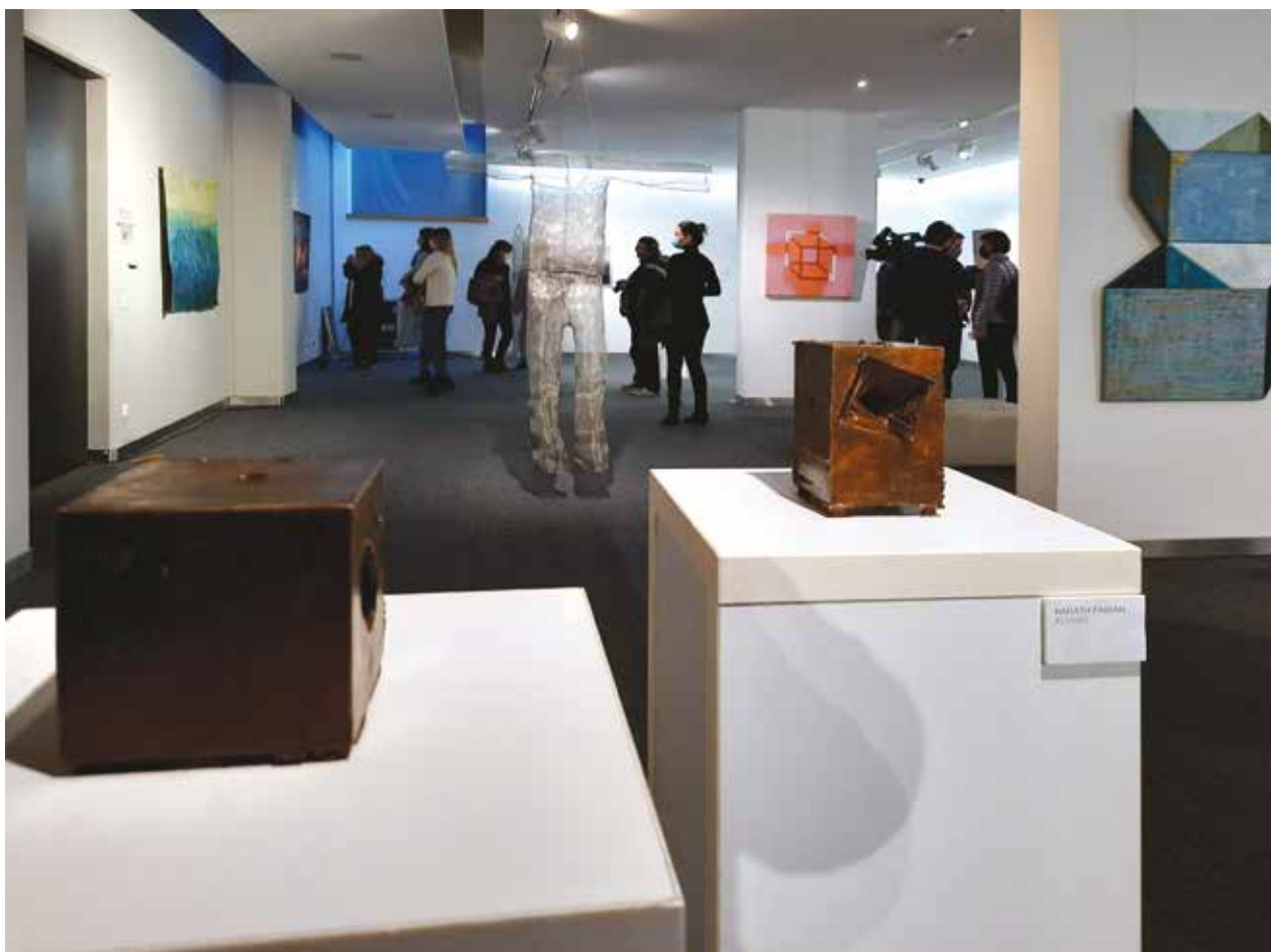
Előtérben Baráth Fábián / Barlang és Átjáró című bronz kisplasztikái