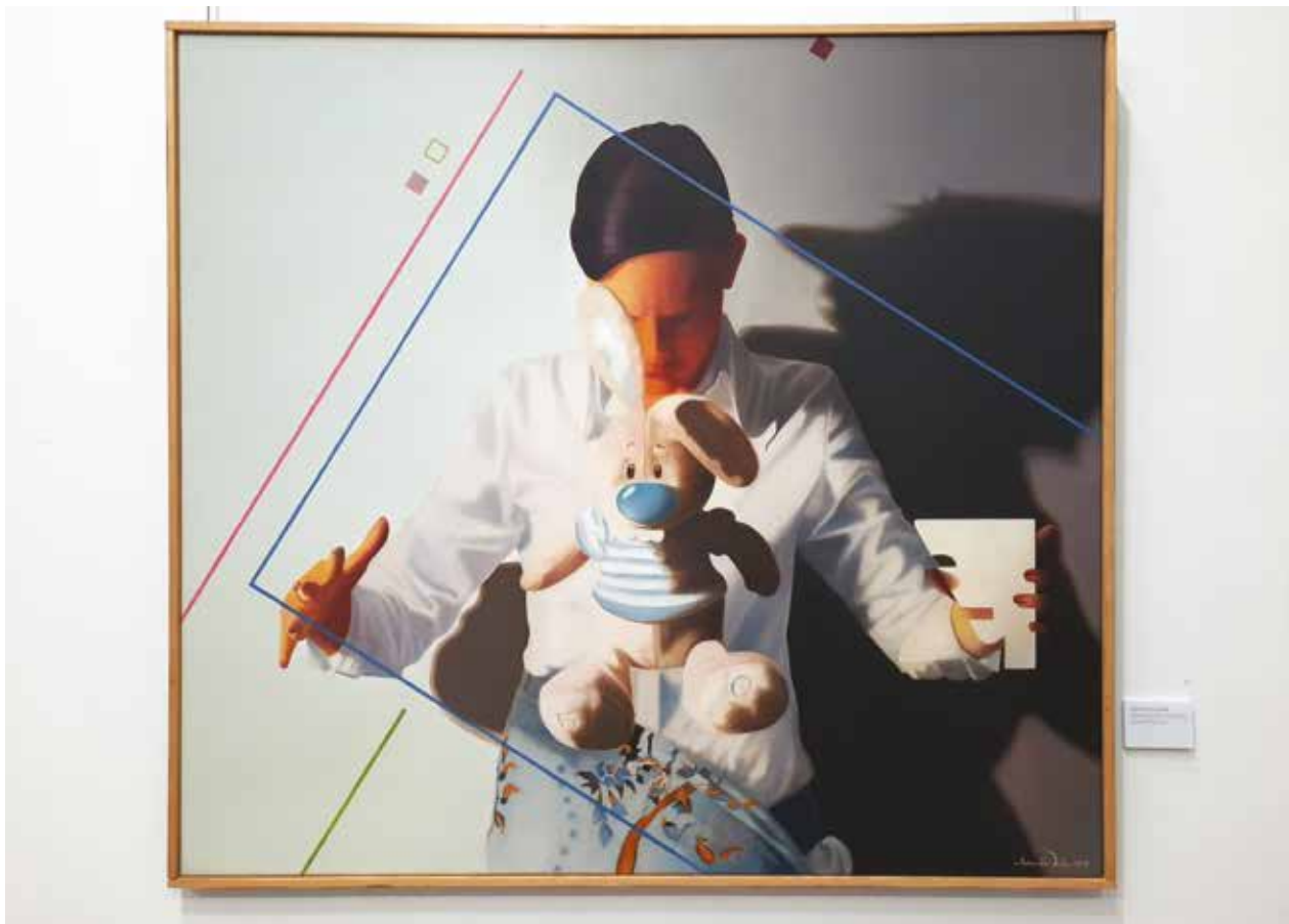
Vidovits Iván / Transz- helyzetek I. (Gravitáció)