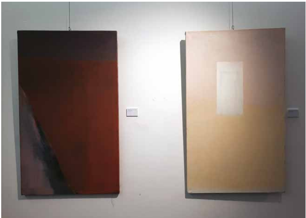
Krajcsovics Éva / Nagyítás és Távolság című festményei

Kívánom minden alkotónak, hogy haladjon tovább a saját maga által megkezdett úton. Kívánom Verebes Györgynek és munkatársainak, hogy továbbra is vállalják ezt a küldetést.