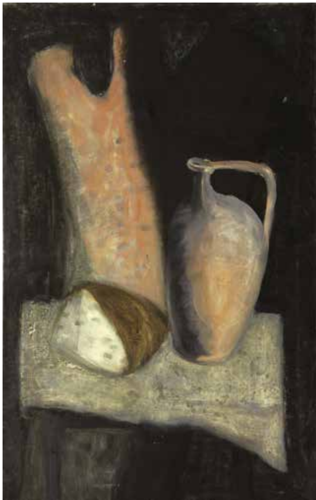
Kenyér és korsó /olaj, vászon, 1962–1966