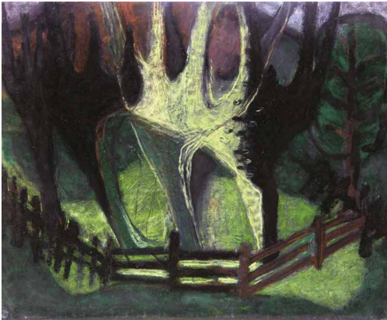
Bús éjféli óra / olajpasztell, papír, 1962–1966