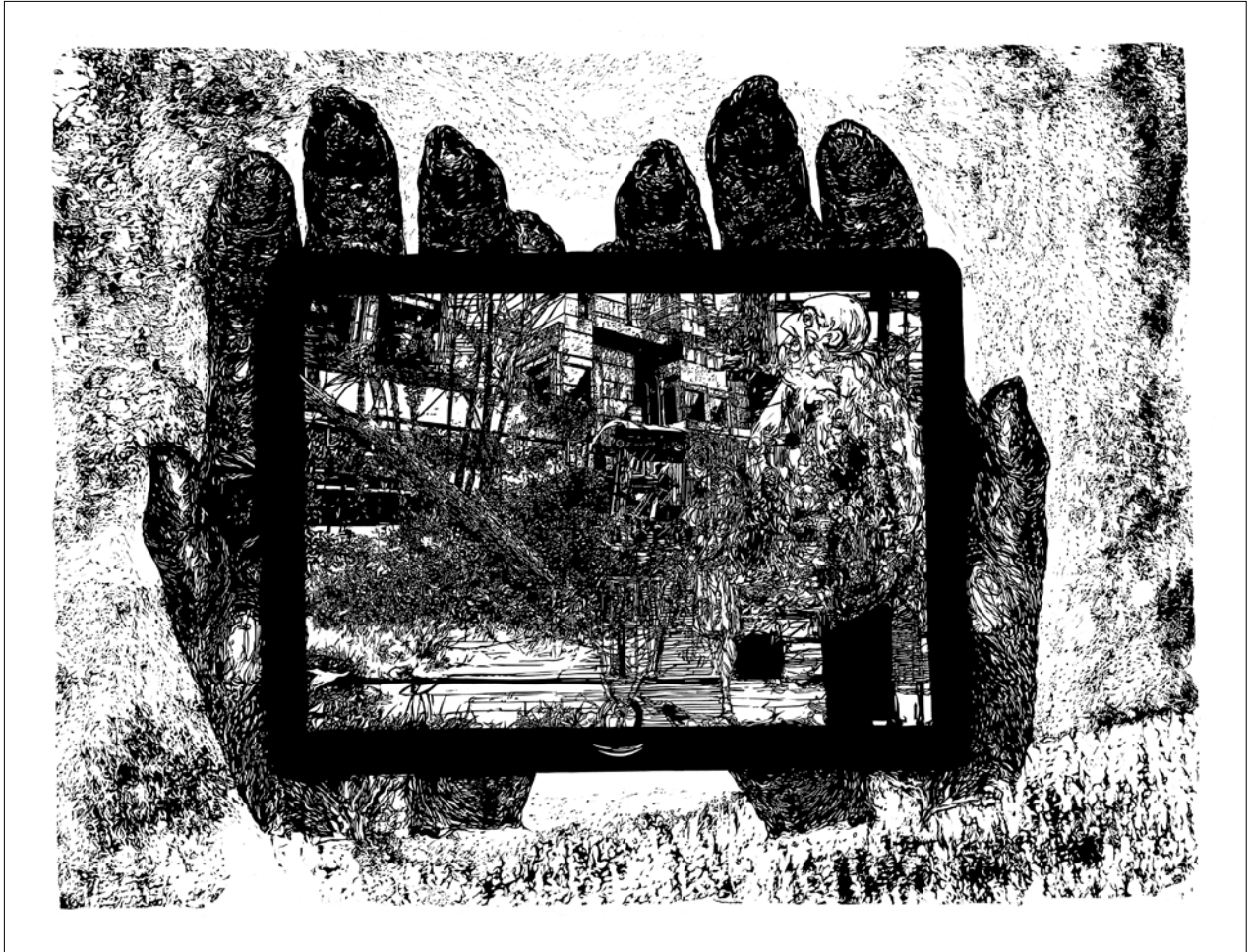
Bugyi István József / Revolúció 2. , linómetszet, 55x72 cm, 2020

kimagaslanak, és látszólagos dolgukat végzik. Azonban minél jobban tűnődünk a kép előtt, megtaláljuk az elveszettnek tűnt irányokat és rádöbenthetünk arra, hogy milyen kölcsönhatásban vagyunk saját magunkkal, környezetünkkel, a formált, épített világunkkal, bolygónkkal.