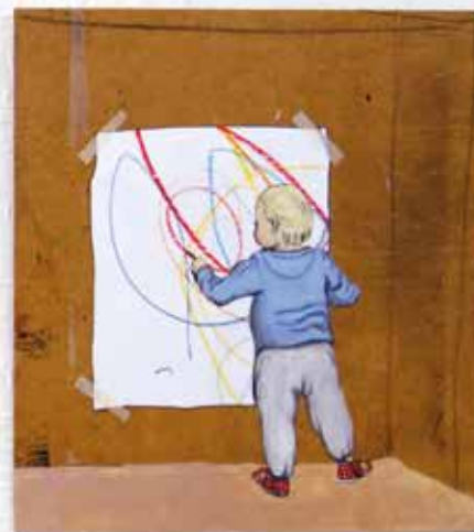
Rajzolás, kombinált technika, 2021 Rajzolás, kombinált technika, 2021

Könyv olvasás közben / 2021 és Rajzolás / 2021