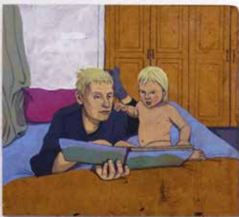
Könyv olvasás közben, 2021 Könyv olvasás közben, akril, 35x51

– Igen, a meztelenség de-tabuizációjával is foglalkozom, mint a természetesség egy formájával. Az emberiség és az emberi egyenlőség bizonyos