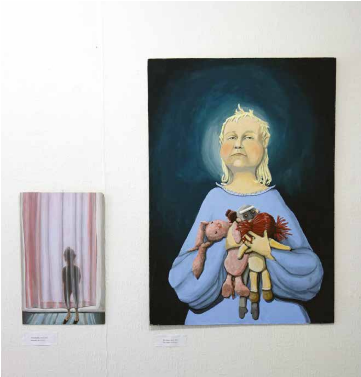
Bújócska / 2021 és Cím nélkül / 2021