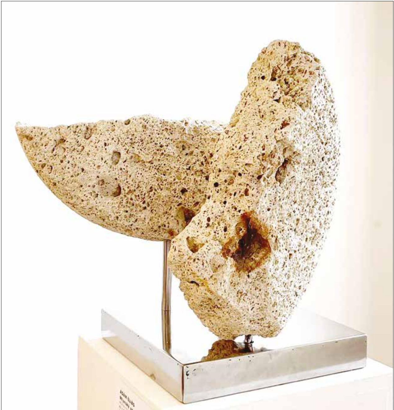
Éliás Ádám szobrászművész, Őrlőszekér , malomkő töredékek- mészkö, vas 2021

Tóth Emese munkájában az egyén belső folyamatainak változását, egy gondolatmenet értelmezési térképét rajzolja fel a Mind map című fotó objektumában. A néző számára a történet a saját maga alkotta asszociációk eredménye, így nem beszélhetünk szokványos értelemben vett sorozatról, mégis az emberi agy mintakereső szoftvere fűzi össze a látottakat.