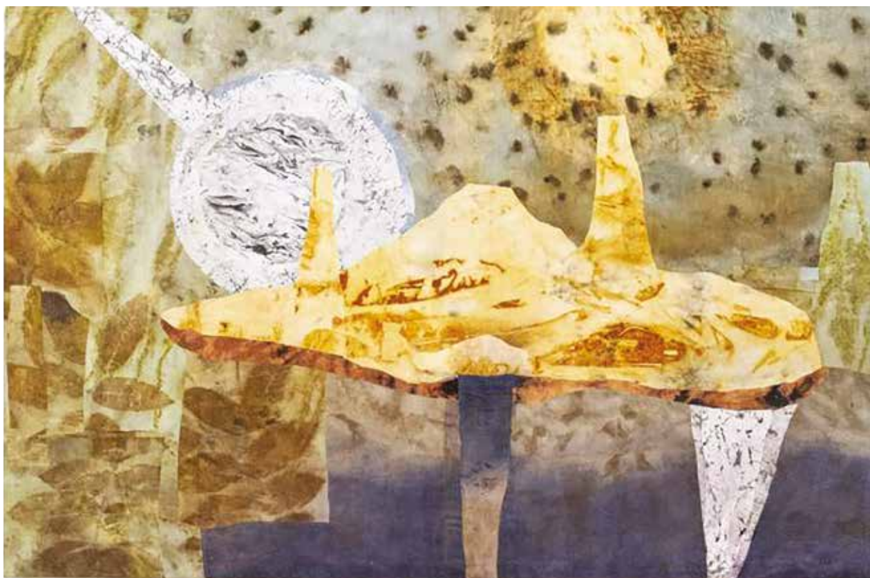
Csernok Barnabás festőművész Solar power című kollázsa.