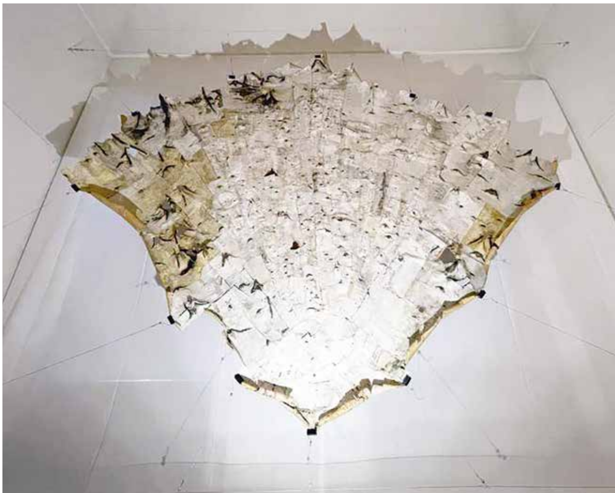
Szunyog Júlia szobrászművész nyírfakéregből készült alkotása.