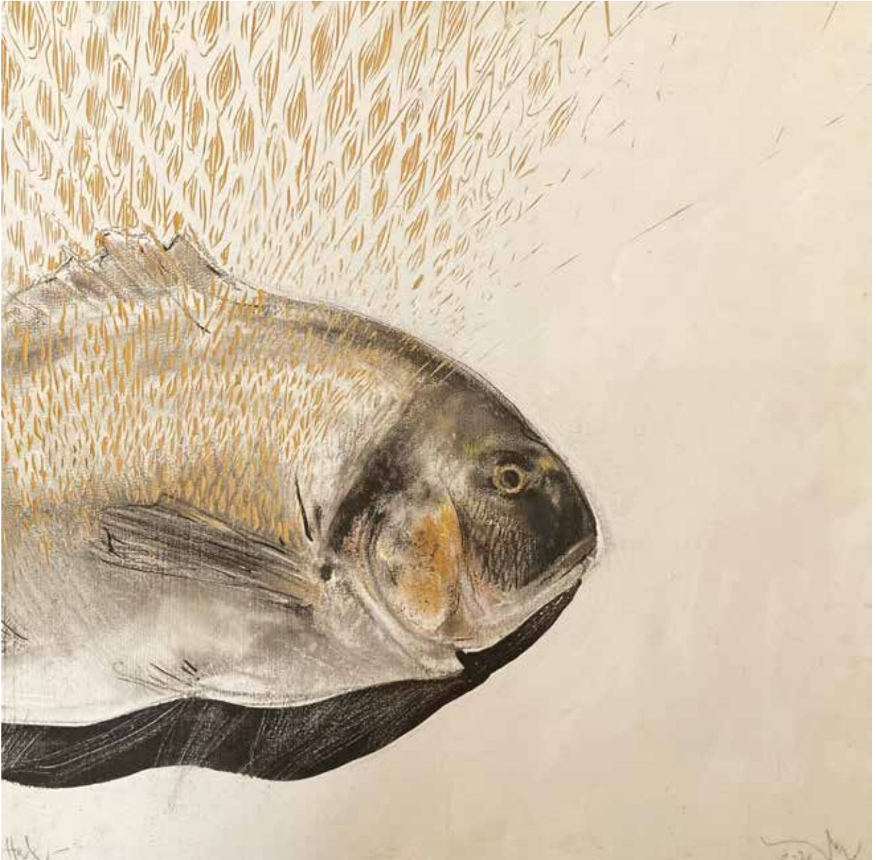
Varga Bendek / Hal / vegyes technika, 2020

szet kérdéskörébe tartozik. Ehhez kapcsolódhat az eltakarás, elfedés motívuma, a rétegek esztétikája.