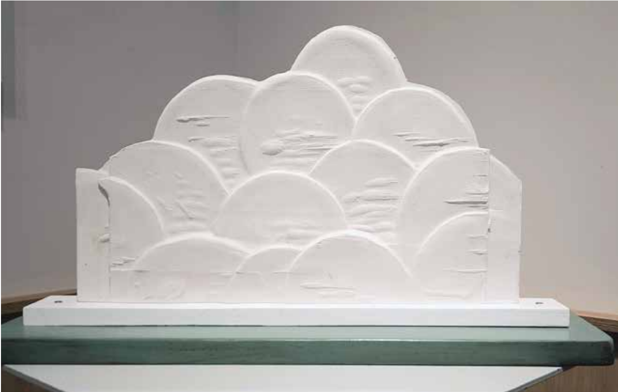
Előtanulmány a Bokrok, fák, fény című kisplasztika sorozathoz.