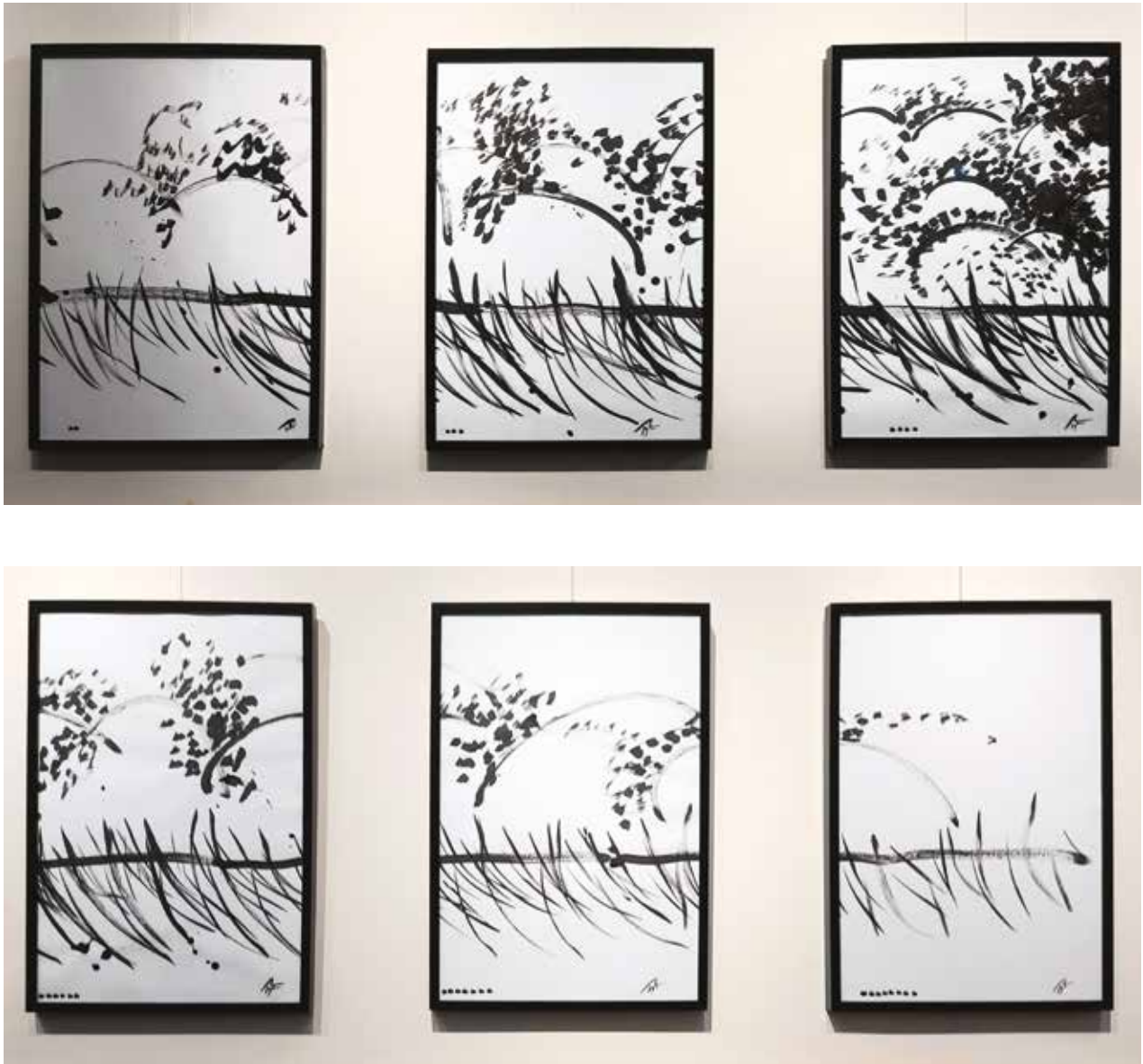
Táj nyolc ablakkal, részlet / tusrajz, 2019

Ha jobban elmélyedek a rajzokban, a fehér papír és a fekete tus kalligrafikus találkozásában rokonságot látok a japán zen-piktúrával, még akkor is, ha ezek a jegyek formailag talán nem teljes mértékben, de a szellemi meditáció szintjén mindenképpen felfedezhetők a Szunyogh-művekben. A kisplasztikák és érmek szigorú anyagkezelésének kötöttsége után, a fehér felületen a tus és ecset szabadsága új világra nyitott ajtót a művésznak. Az üres felület nagy kihívás mindenkinek, legyen az író, költő, képzőművész, mert az igazi kérdés az, vajon mikor felel meg igazán annak a belső kényszernek, ami az alkotásra ösztönzi, ha szöveget ír, rajzol, fest a papírra, vagy