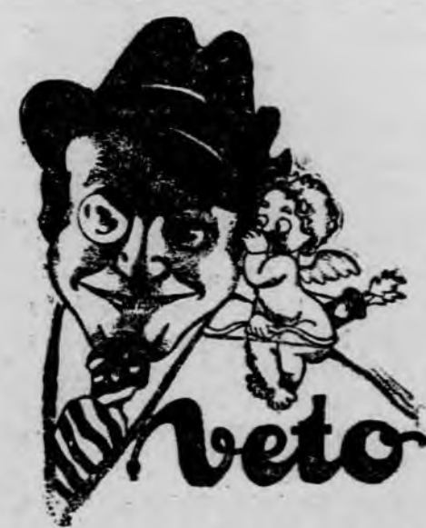
Férfiaknak a patikában

A Magyar Cserkész Leányosztóvetség 10 éves fennállása alkalmából vasárnap délelőtt 11 órakor az I. ker. Fehérvári-uti polgári iskola udvarán jubilárius díszszemlét és zászlóavató-ünnepélyt rendezett.