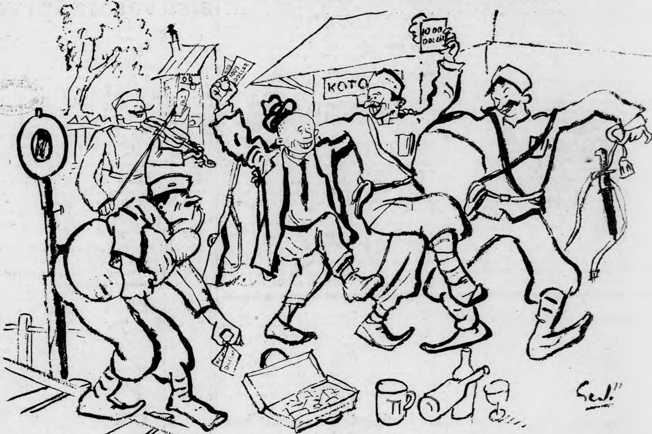
VACUUM-FISCHER MEGKEZDI A JUGOSZLÁV-MAGYAR-KÖZELEDÉST