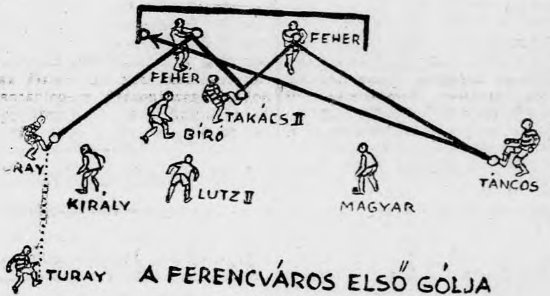
A FERENCVÁROS ELSŐ GÓLJA