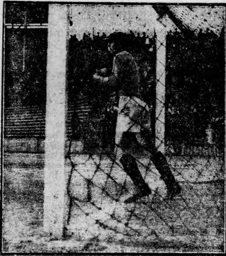
A gólgyanus helyzet

Ujpest ettől kezdve folyóan biztonságos játszik. Szép munkájuk gyakran ragadtatja tapsra a közönséget.