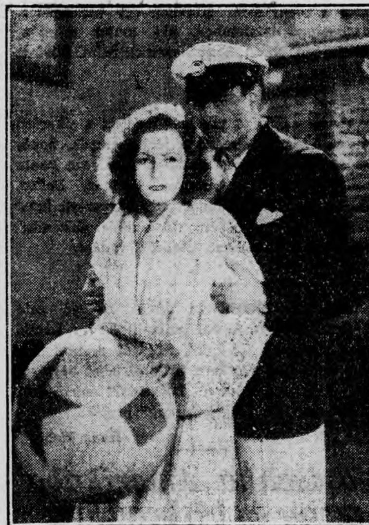
GRETA GARTO és NILS ASTHER a „Perzselő vágyak” főszereplői

és felvonulnak benne Hollywood legnépszerűbb sztárjai. A Metro összes ismert színésze játszik a revüben, ezenkívül még kétszáz görli és egész se-