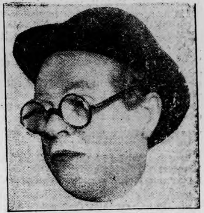
PALLENBERG, aki szerdán kezdi meg vendégszereplését a Vigszínházban