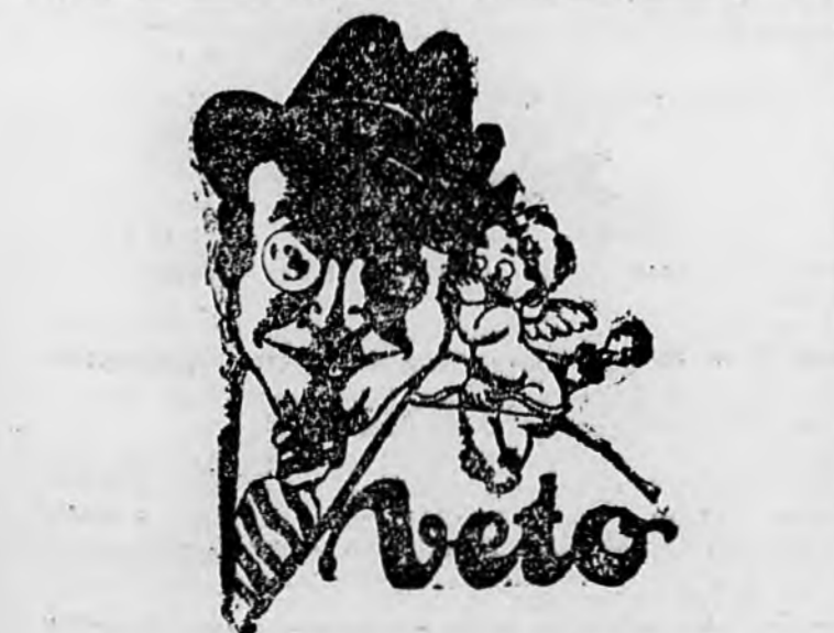
Vérfiaknak a patikában

Billy Arnold, a verseny favoritja és a múlt évi győztese már biztos nyerőnek látszott, amikor Johnsonnal összeütközött és a versenyt fel kellett adnia. A versenyben az indianapoliszi Louis Schneider győzött (Bowes Seal Fast) 5 ó. 6. 10 p. 27.94 mp-es idővel, ami 155.495 km-es órátlagnak felel meg. 2. Frame (Indianapolis) 5 ó. 6. 11 p. 01 mp. 155.149 km-es órátlag. 3. Hepburn 5 ó. 6. 18 p. 23 mp.