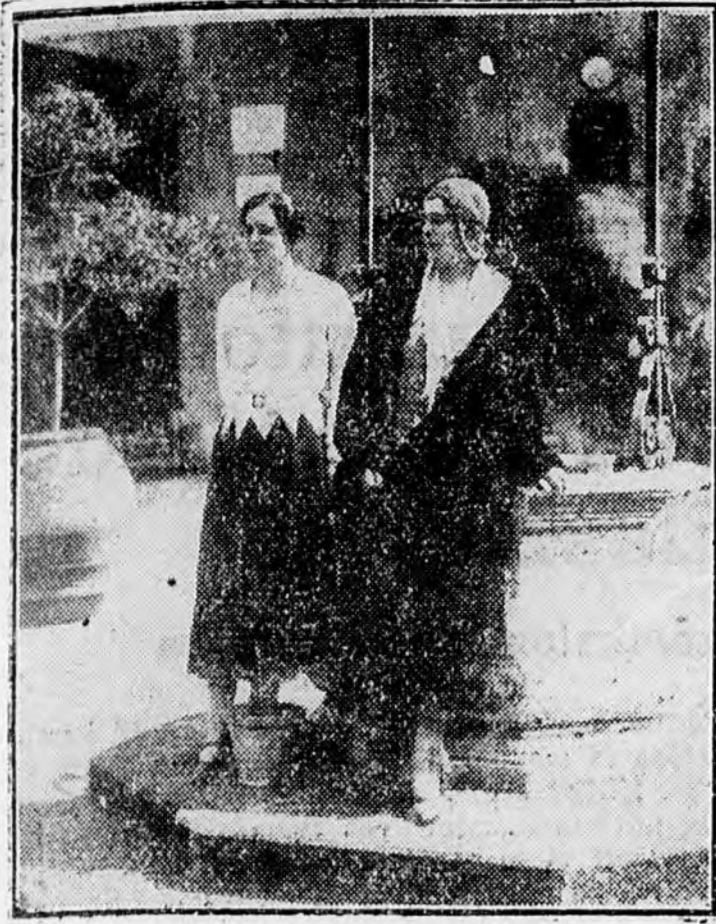
MÁRIA ROMÁN KIRÁLYNÉ LEÁNYÁVAL, ILIENA HERCEGNŐVEL A RÓMAI SANGALLO KASTÉLY UDVARÁN.